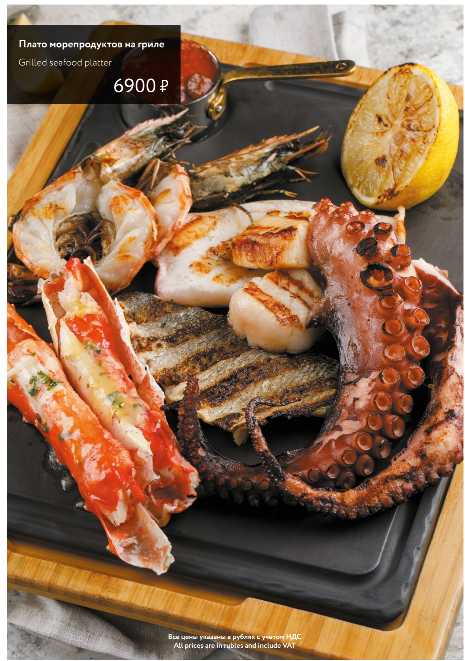
Плато морепродуктов на гриле Grilled seafood platter 6900 ₺