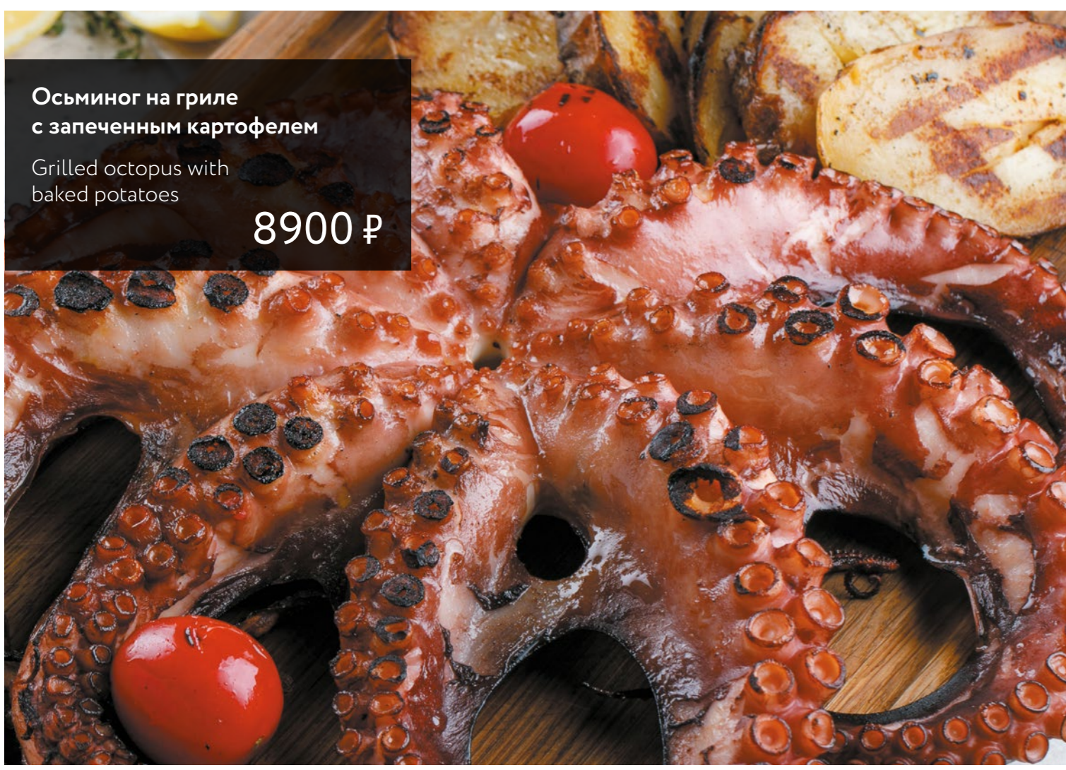
Осьминог на гриле с запеченным картофелем Grilled octopus with baked potatoes 8900 ₺