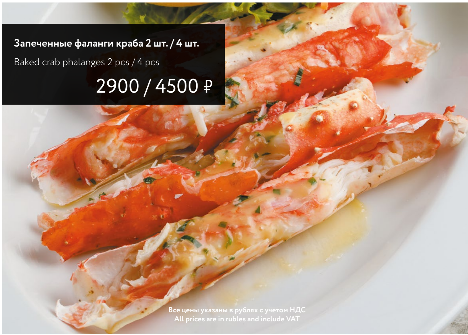
Запеченные фаланги краба 2 шт. / 4 шт. Baked crab phalanges 2 pcs / 4 pcs 2900 / 4500 ₺

Все цены указаны в рублях с учетом НДС All prices are in rubles and include VAT