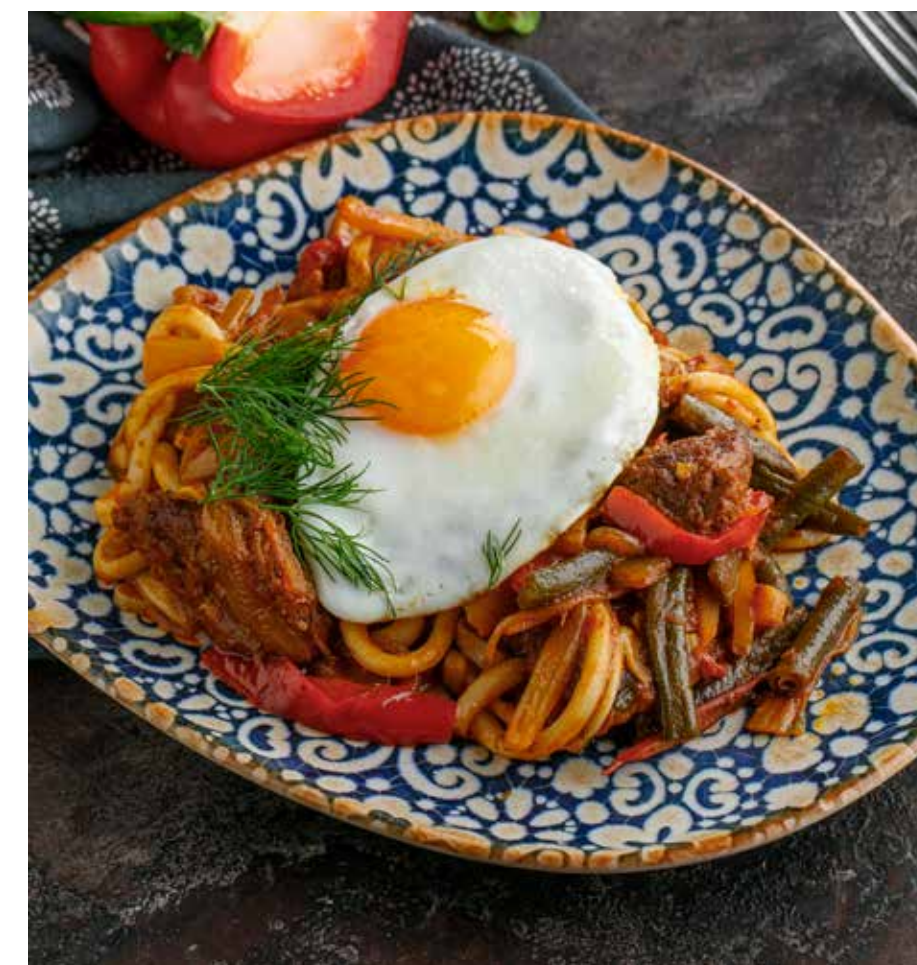
КОВУРМА-ЛАГМАН С ГОВЯДИНОЙ