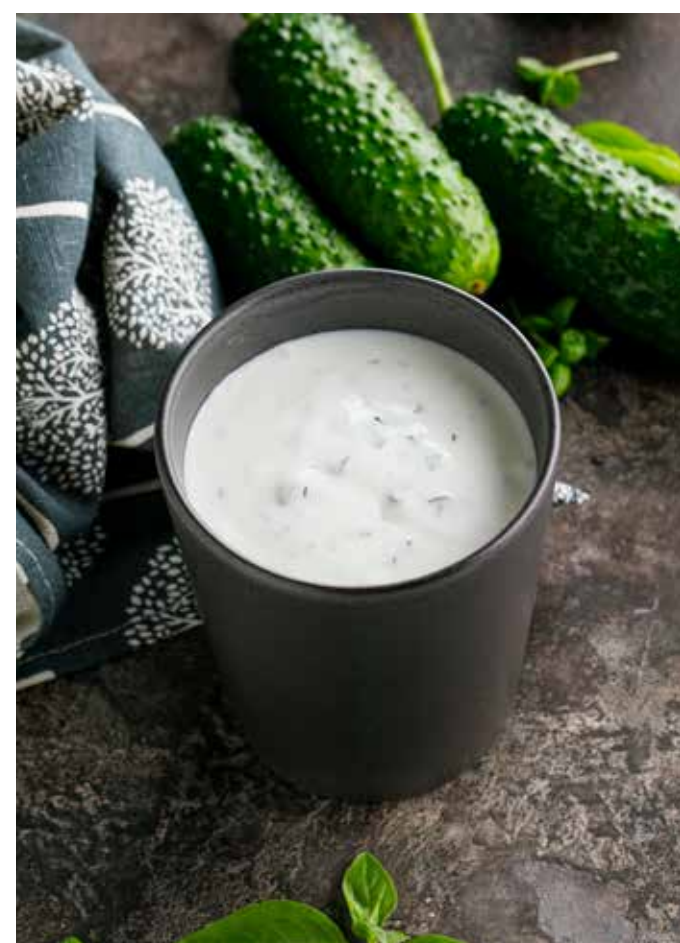
АЙРАН ОТ ШЕФА