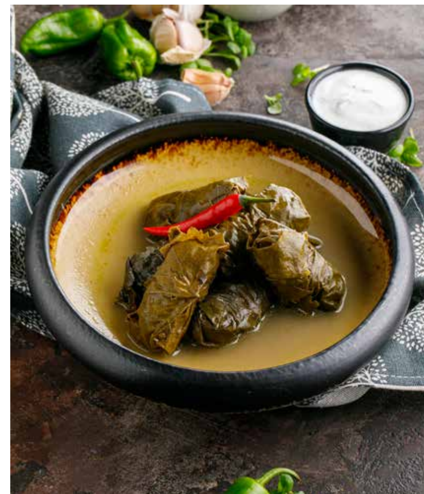
ДОЛМА С БАРАНИНОЙ