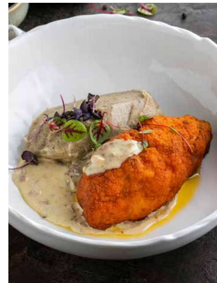
ХРУСТЯЩАЯ КУРИНАЯ КОТЛЕТА С ТРЮФЕЛЬНЫМ ПЮРЕ