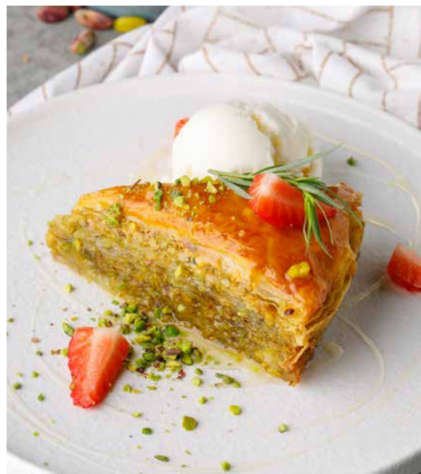
ПАХЛАВА С ФИСТАШКОВЫМ ПРАЛИНЕ И ВАНИЛЬНЫМ МОРОЖЕНЫМ