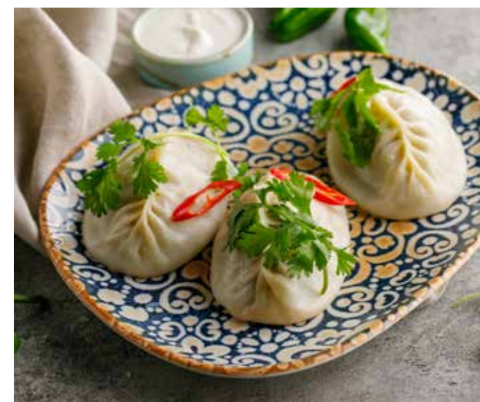
МАНТЫ С БАРАНИНОЙ