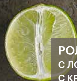
РОЛЛЫ ТЕМПУРА С ЛОСОСЕМ 390 Р С КРЕВЕТКОЙ 390 Р С УГРЕМ 450 Р