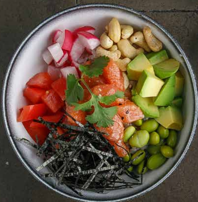
ПОКЕ С ЛОСОСЕМ 650 Р С ТУНЦОМ 650 Р