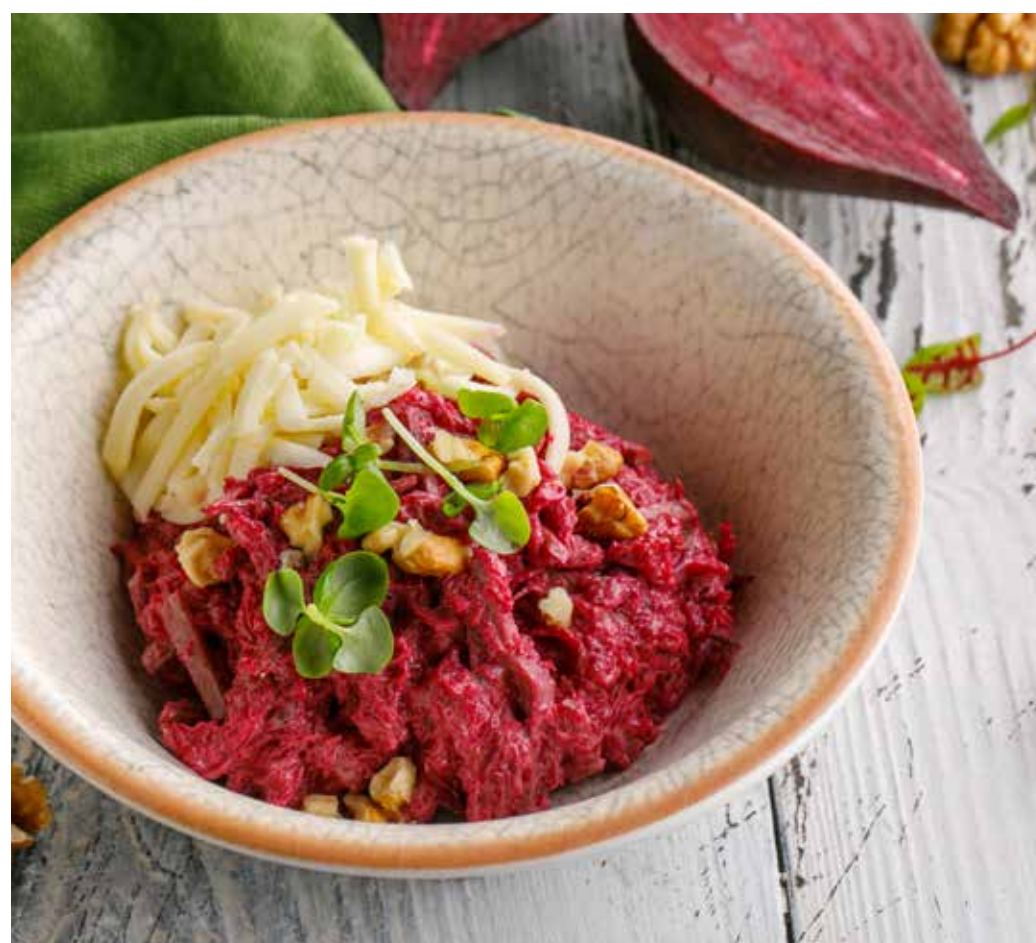
САЛАТ СО СВЕКЛОЙ, ТЕЛЯТИНОЙ И КОПЧЕНЫМ СЫРОМ