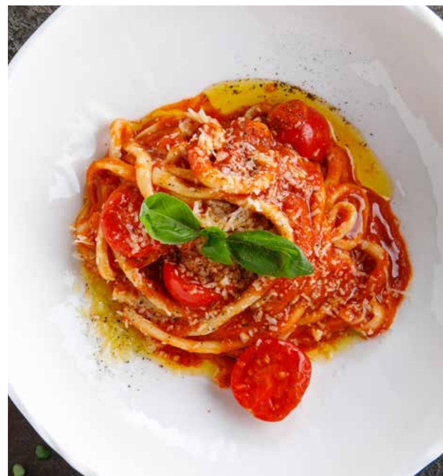
ДОМАШНЯЯ ПАСТА «ПОМИДОРНИ»