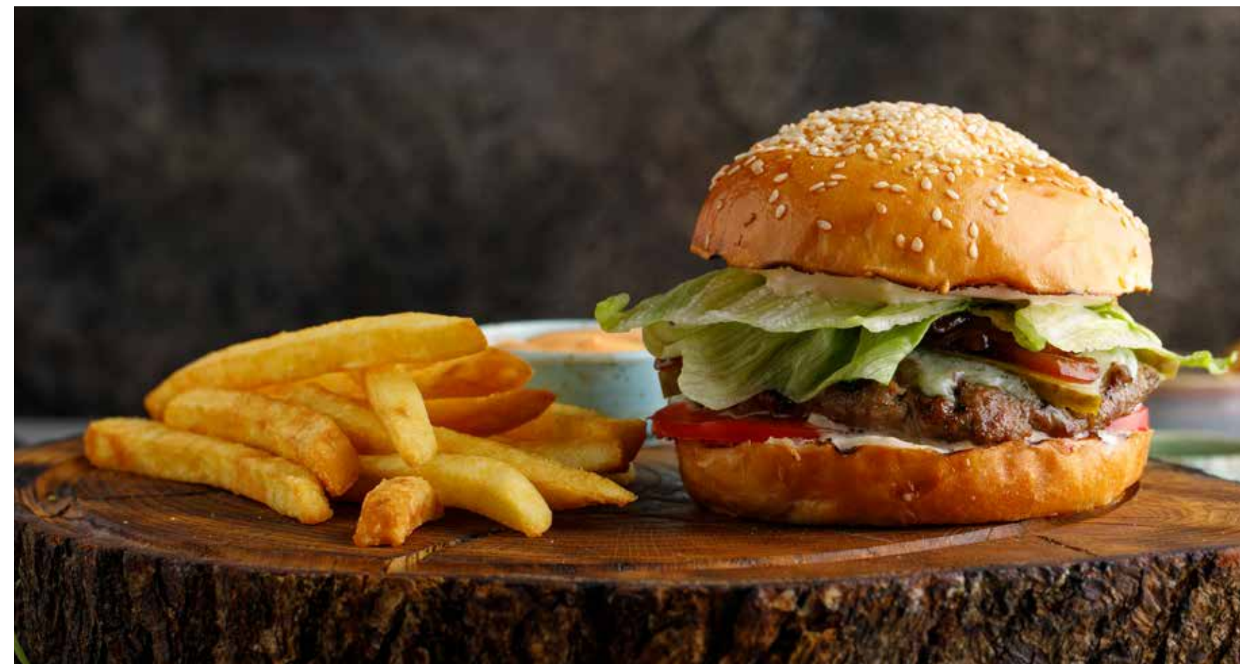
БУРГЕР С ГОВЯДИНОЙ