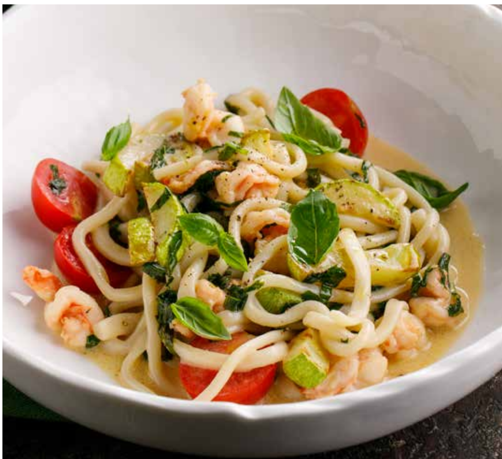
ДОМАШНЯЯ ПАСТА С КРЕВЕТКАМИ И ЦУКИНИ