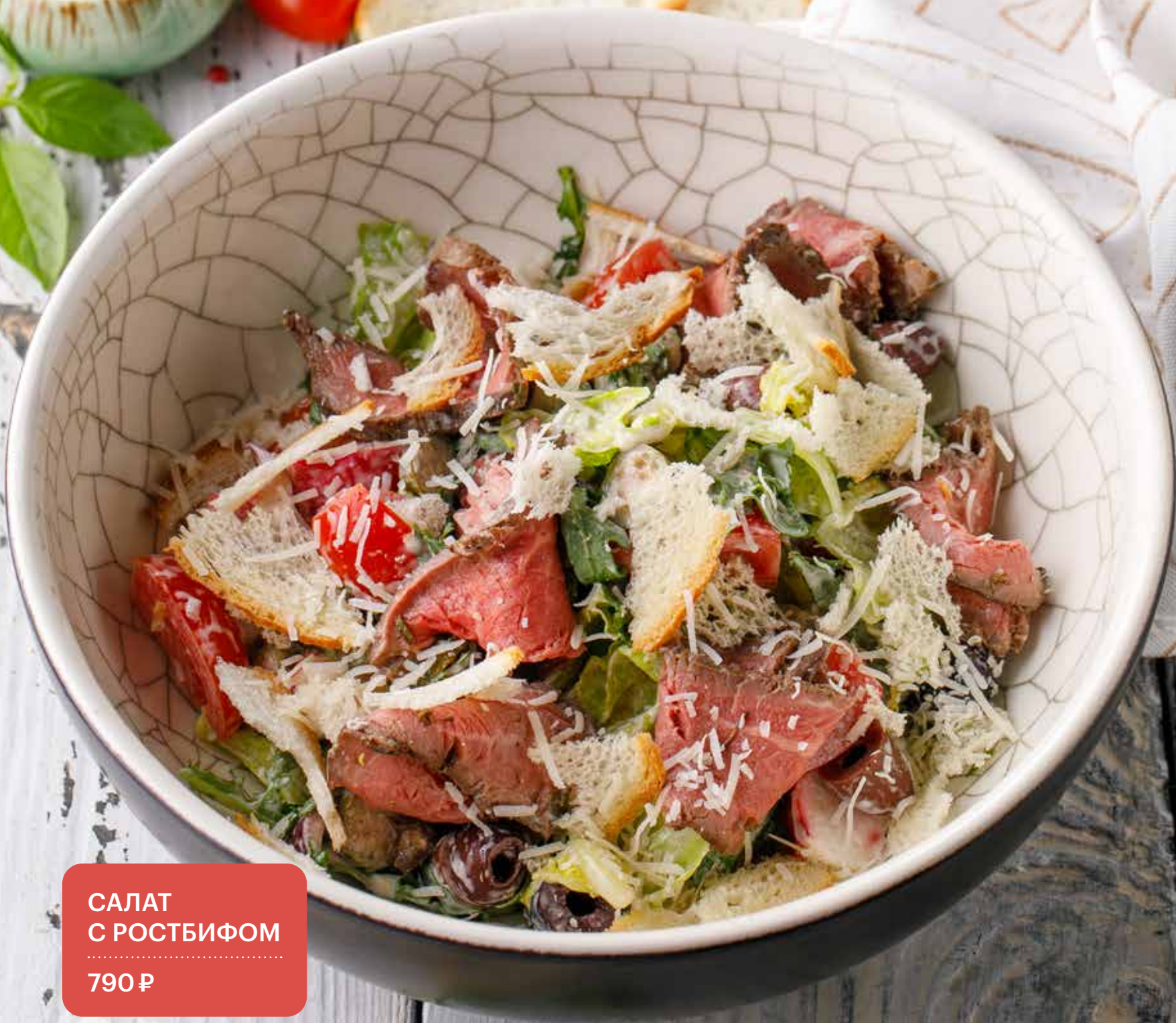
САЛАТ С РОСТБИФОМ 790 Р