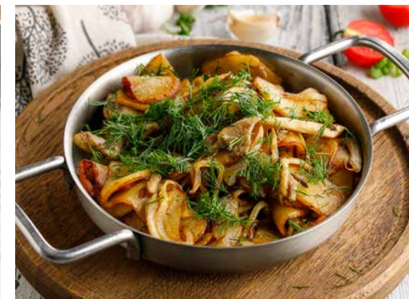
ЖАРЕНЫЙ КАРТОФЕЛЬ С ГРИБАМИ