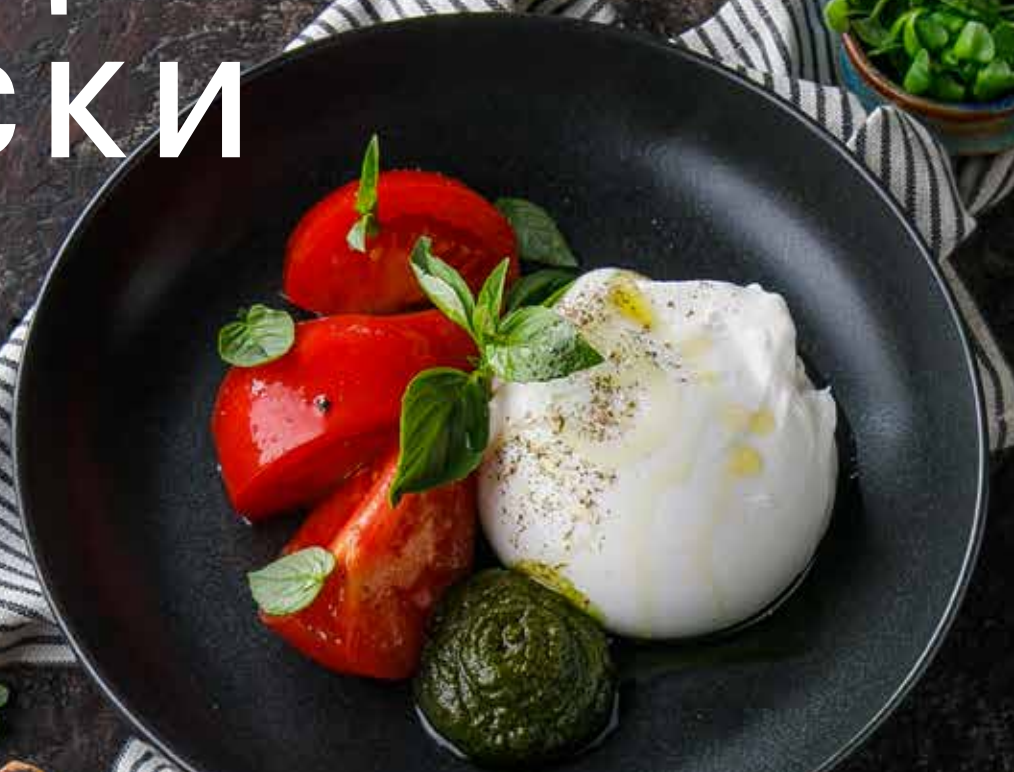
БУРРАТА СО СПЕЛЫМИ ТОМАТАМИ ..... 990 Р