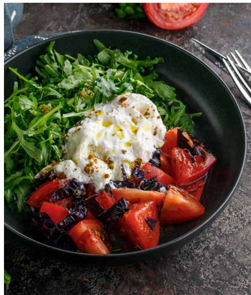
САЛАТ С РУКОЛОЙ И СТРАЧАТЕЛЛОЙ