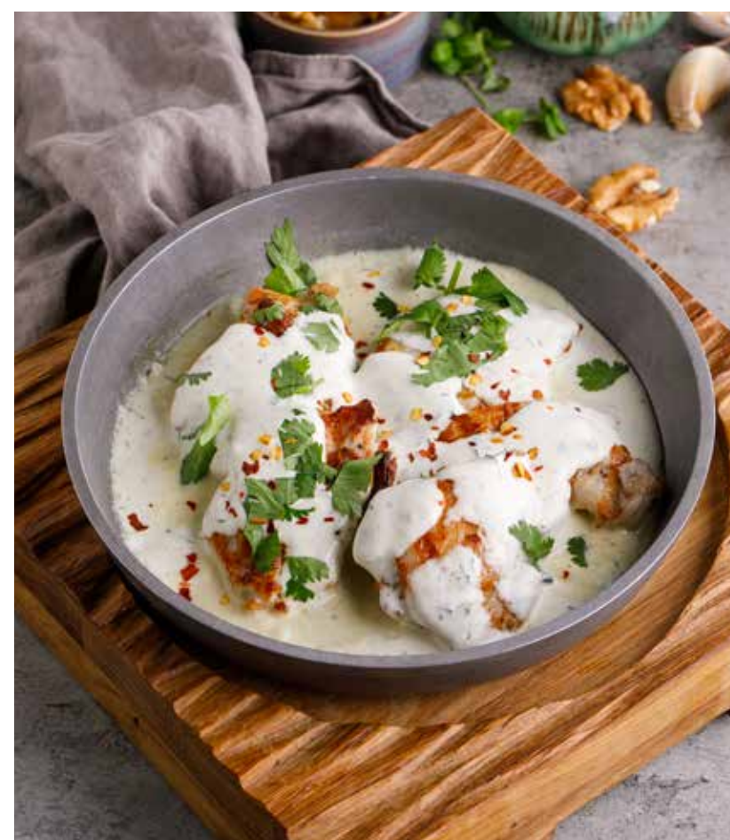
КУРИЦА / КРЕВЕТКИ ПО-ЧКМЕРСКИ