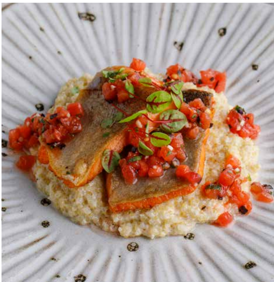
КАРЕЛЬСКАЯ ФОРЕЛЬ С КИНОА И ТОМАТНОЙ САЛЬСОЙ