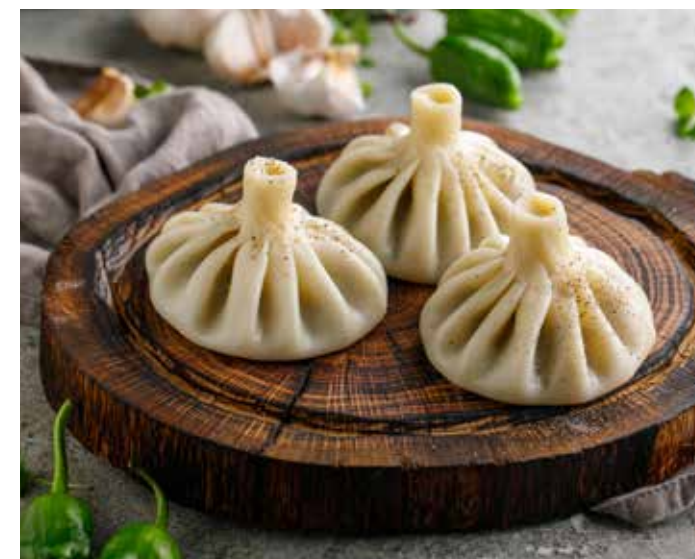
ХИНКАЛИ С БАРАНИНОЙ / СО СВИНИНОЙ И ГОВЯДИНОЙ