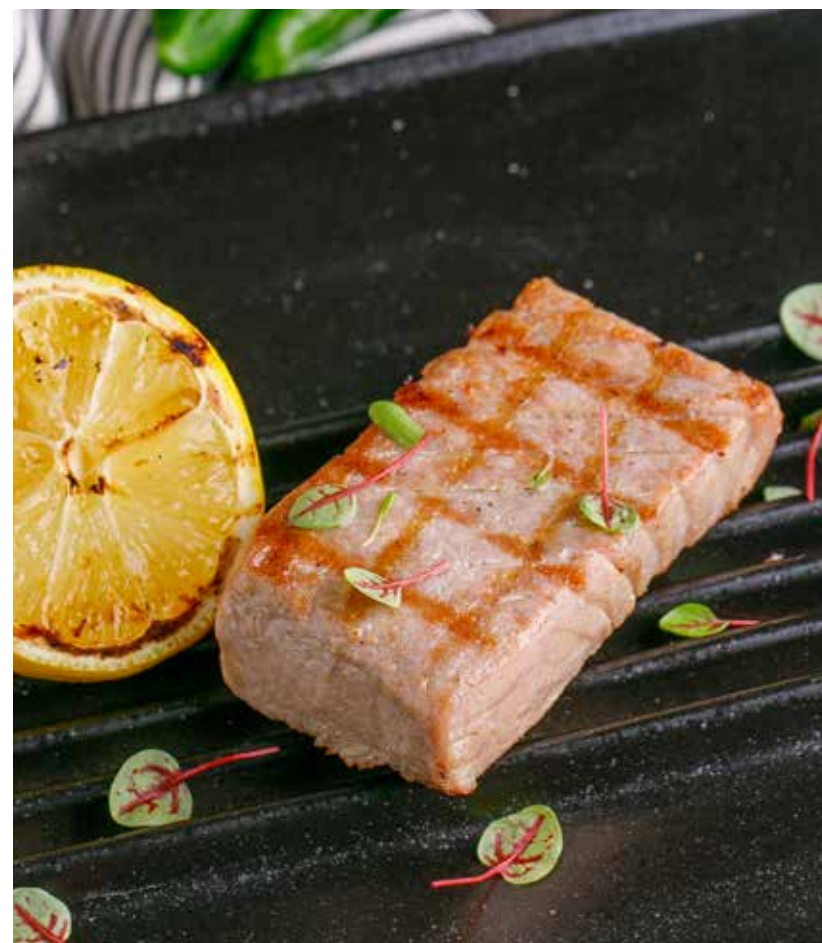
СТЕЙК ИЗ ТУНЦА