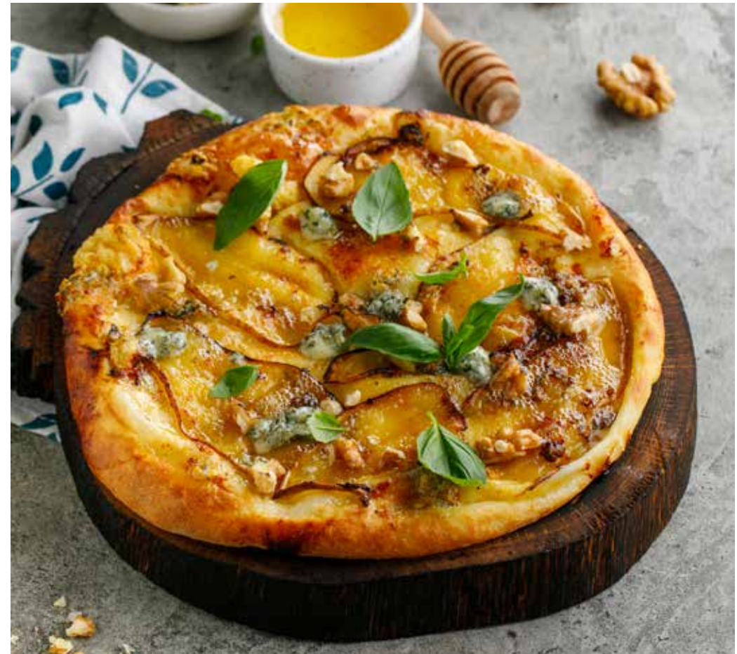
ХАЧАПУРИ С ГРУШЕЙ И ГОРГОНЗОЛЫ