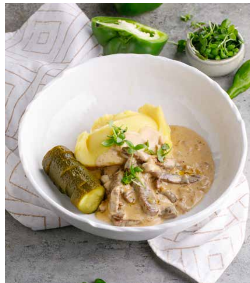
БЕФСТРОГАНОВ С БЕЛЫМИ ГРИБАМИ И КАРТОФЕЛЬНЫМ ПЮРЕ