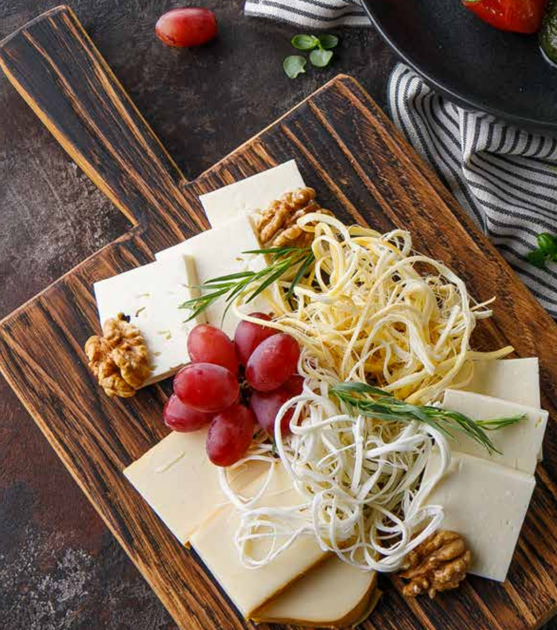
АССОРТИ ИЗ ДОМАШНИХ СЫРОВ ..... 570 Р