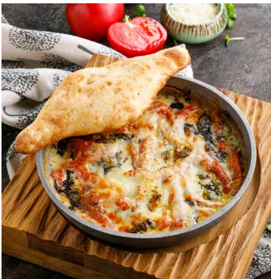
ЖАРЕННЫЙ СЫР СУЛГУНИ / КОПЧЕНЫЙ СЫР СУЛГУНИ С ТОМАТАМИ