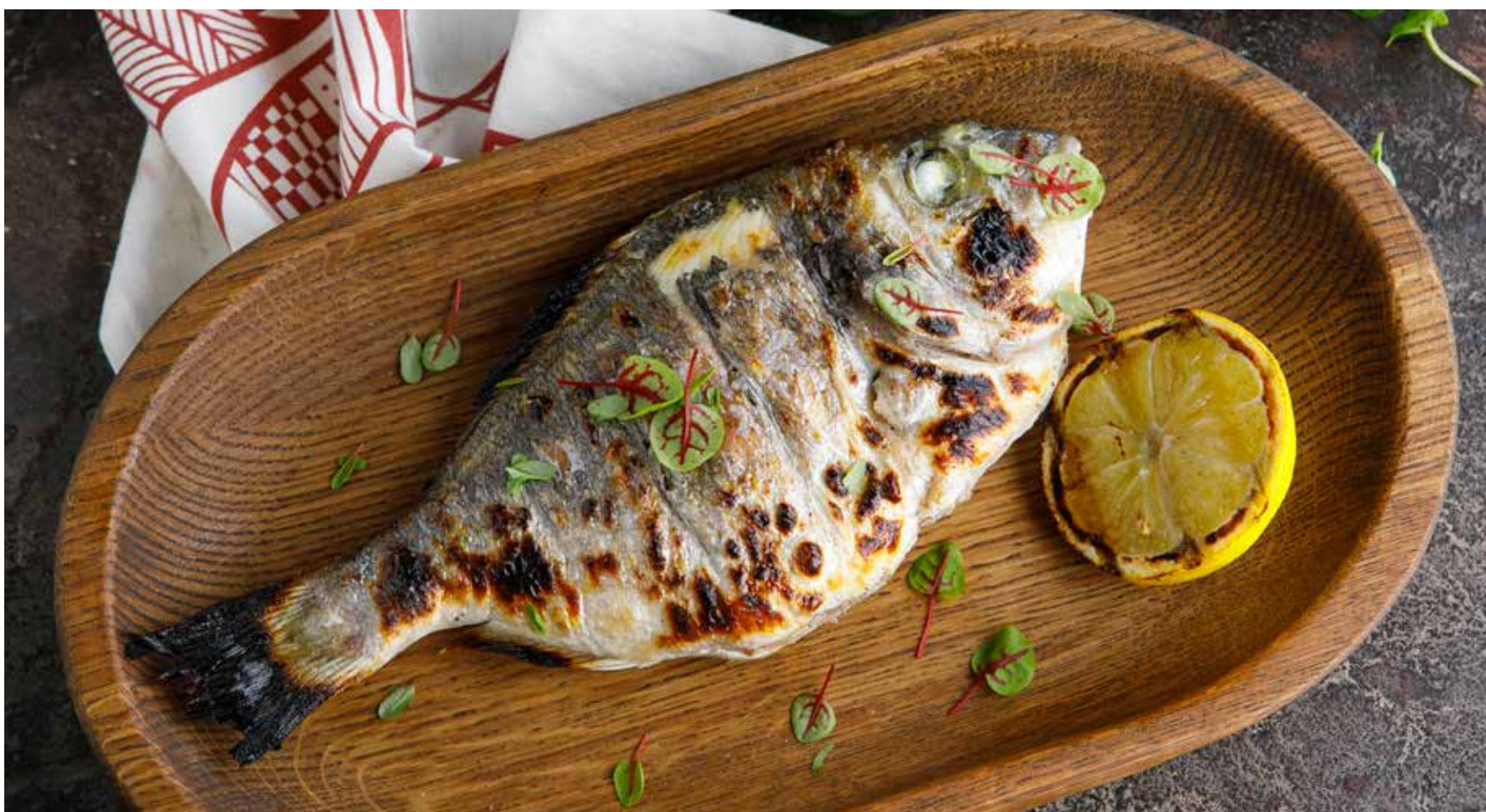
ДОРАДА НА УГЛЯХ