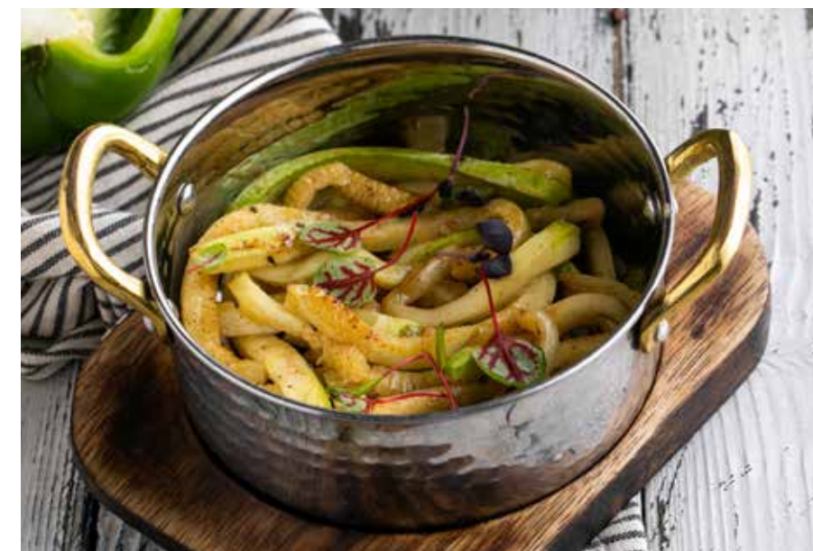
СОТЕ ИЗ КАБАЧКОВ