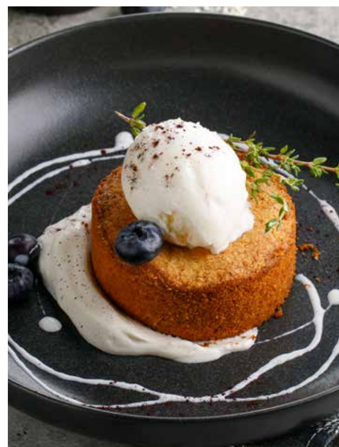
ЧЕРНИЧНЫЙ ПИРОГ С ДОМАШНИМ МОРОЖЕНЫМ