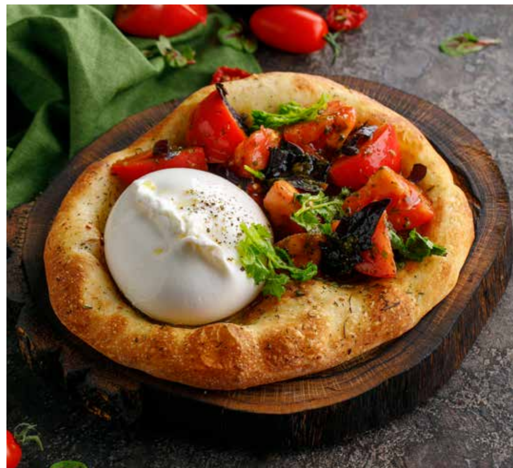
ЛЕПЕШКА С БУРРАТОЙ