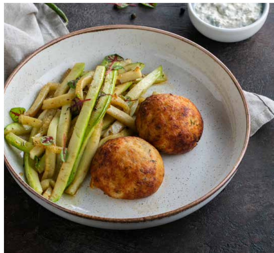
РЫБНЫЕ КОТЛЕТЫ С СОТЕ ИЗ КАБАЧКОВ