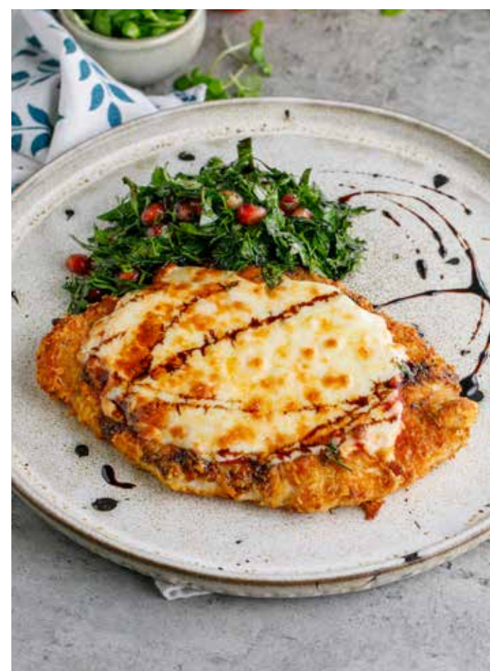
ШНИЦЕЛЬ ИЗ ИНДЕЙКИ