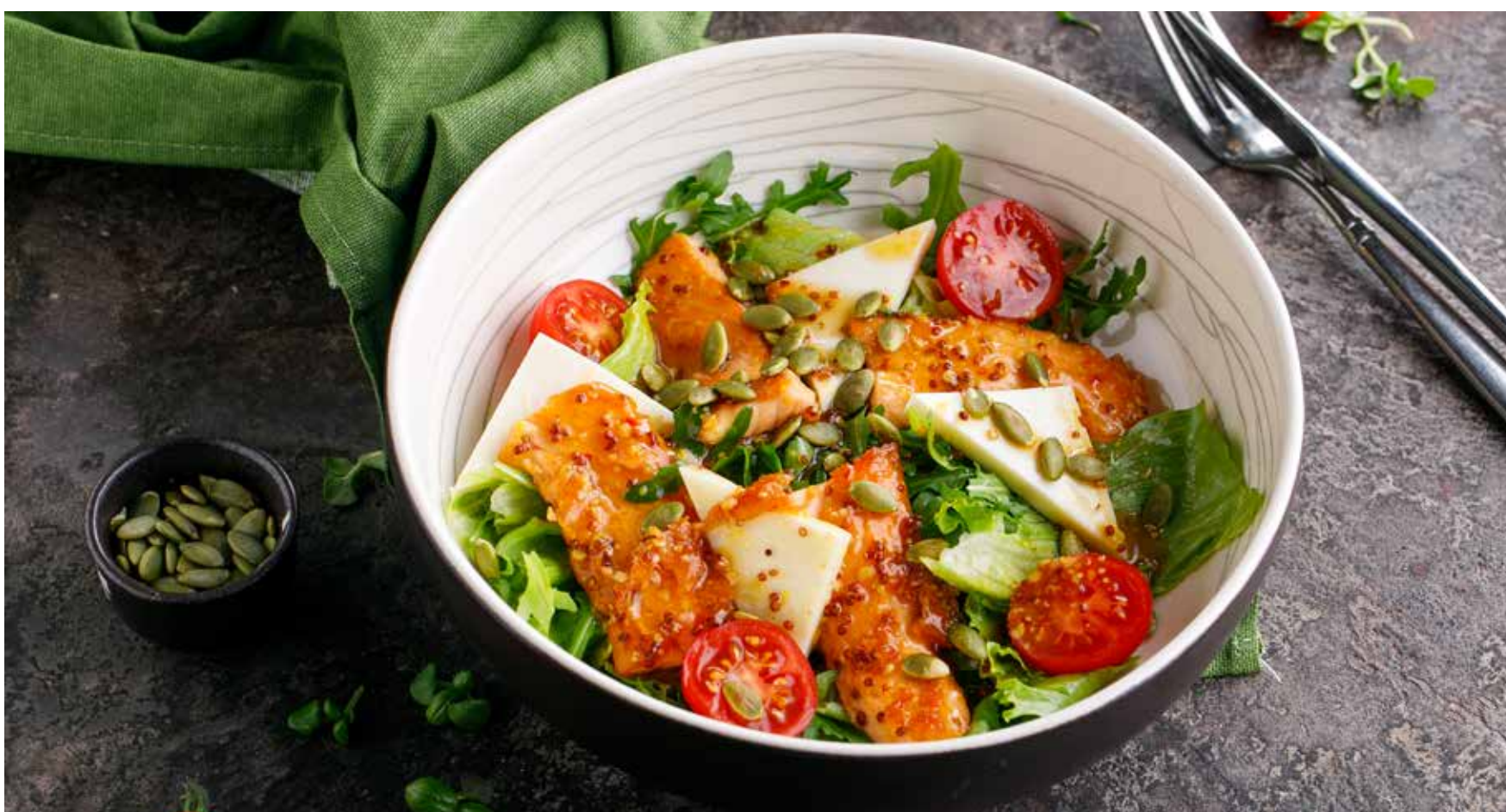
ТЕПЛЫЙ САЛАТ С ЛОСОСЕМ