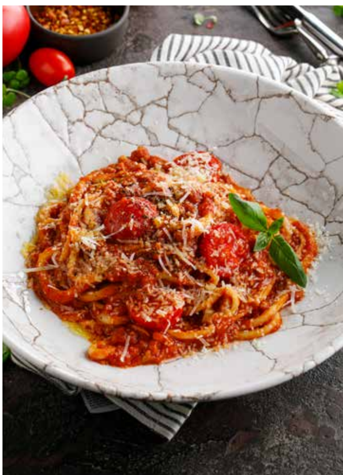
ДОМАШНЯЯ ПАСТА «БОЛОНЬЕЗЕ»