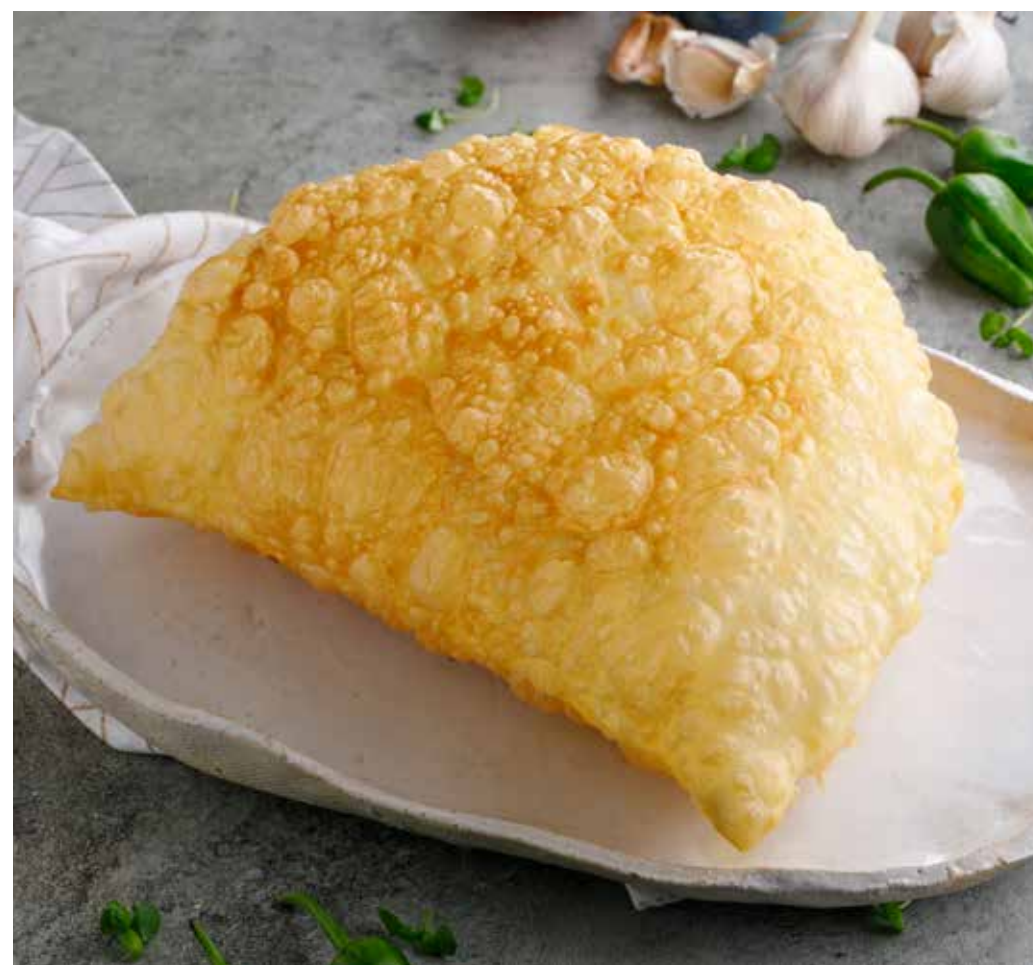
ЧЕБУРЕК С СЫРОМ / БАРАНИНОЙ / ТЕЛЯТИНОЙ