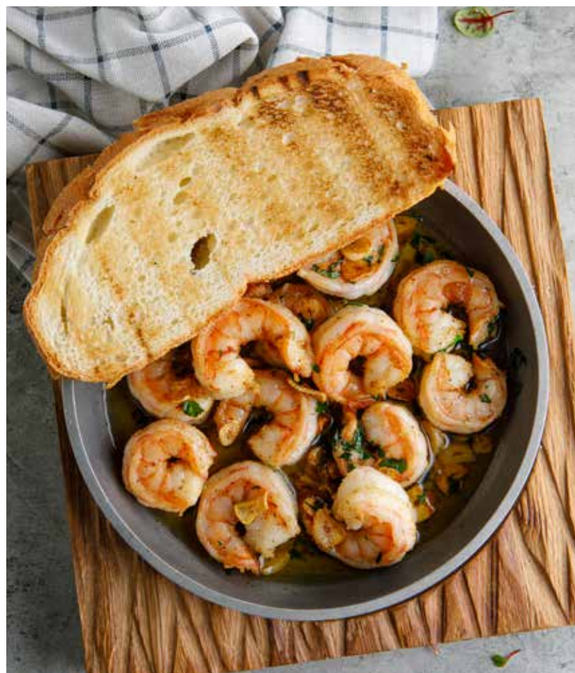
КРЕВЕТКИ С ЧЕСНОКОМ