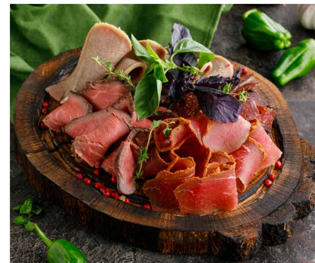
ОТВАРНОЙ ГОВЯЖИЙ ЯЗЫК