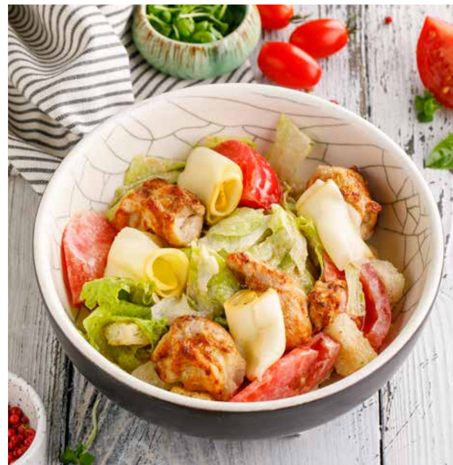
ТЕПЛЫЙ САЛАТ С ДОМАШНЕЙ КУРИЦЕЙ И КОПЧЕНЫМ СЫРОМ