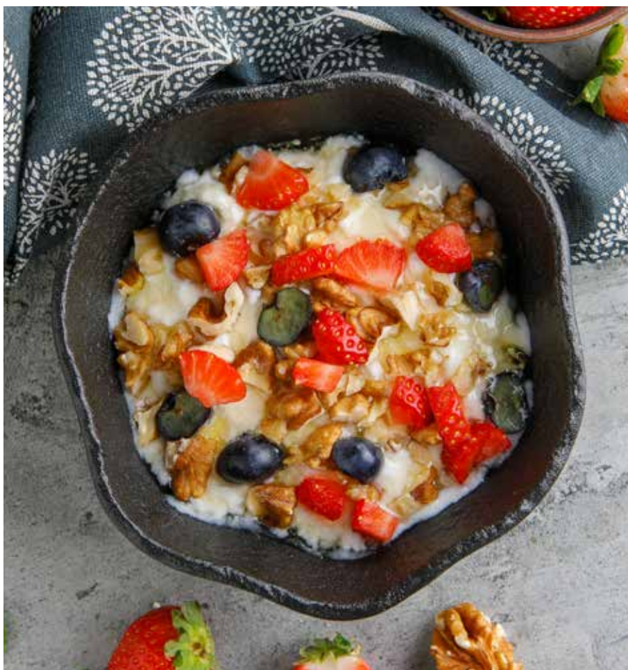
МАЦОНИ С МЕДОМ И СВЕЖИМИ ЯГОДАМИ