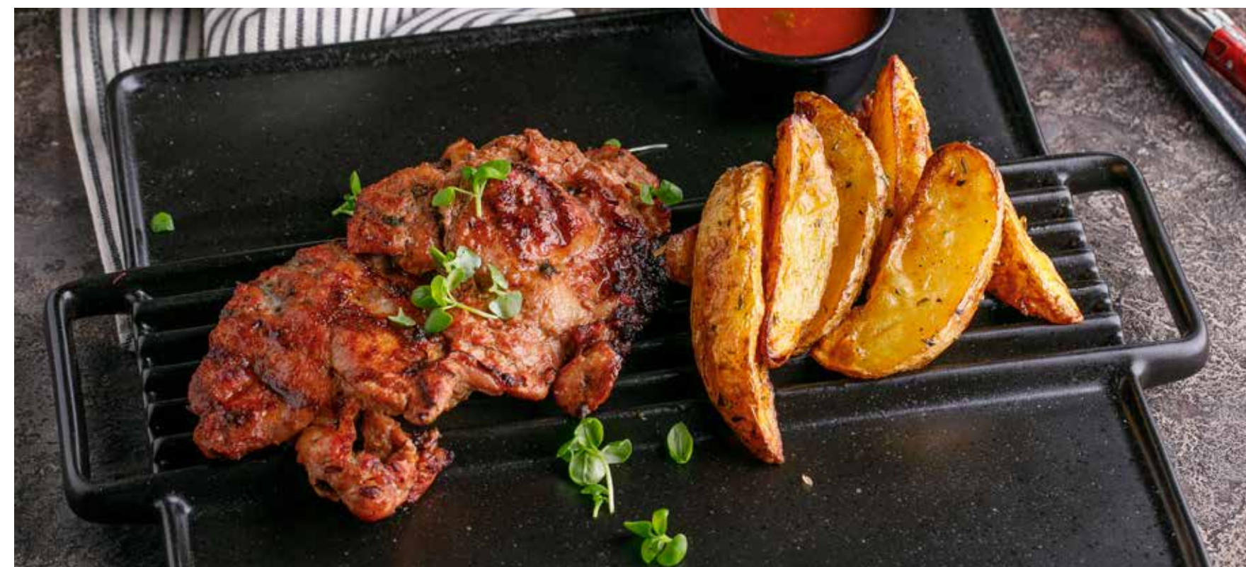
СВИНАЯ ОТБИВНАЯ С КАРТОФЕЛЕМ АЙДАХО