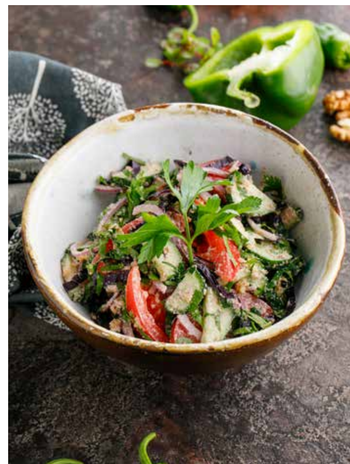
ОВОЩНОЙ САЛАТ ПО-ГРУЗИНСКИ СО СПЕЦИЯМИ / С ГРЕЦКИМИ ОРЕХАМИ