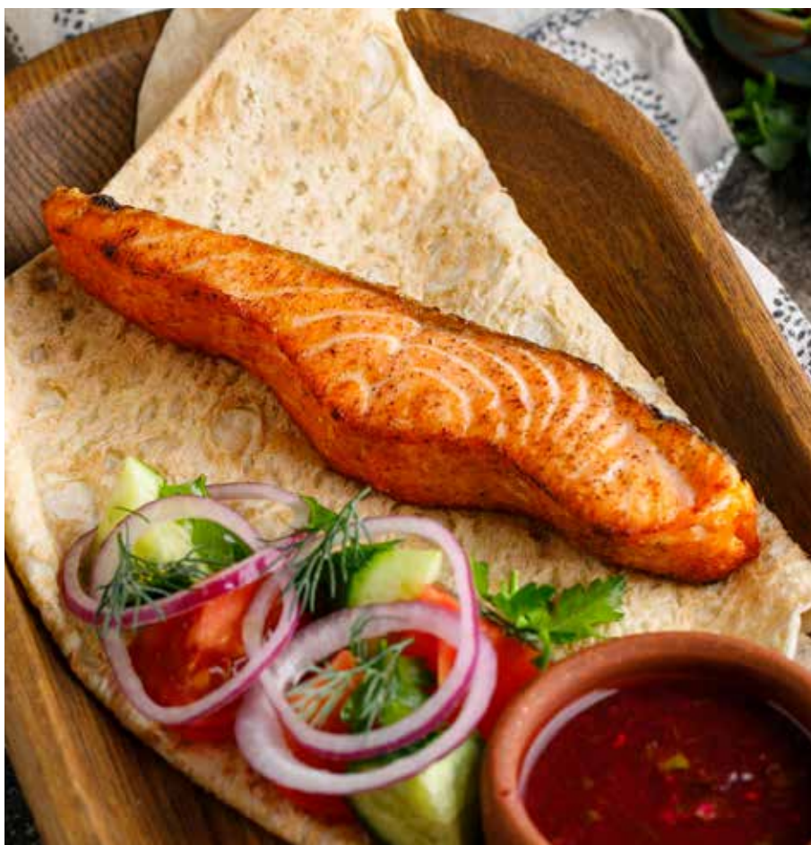
ЛОСОСЬ НА УГЛЯХ