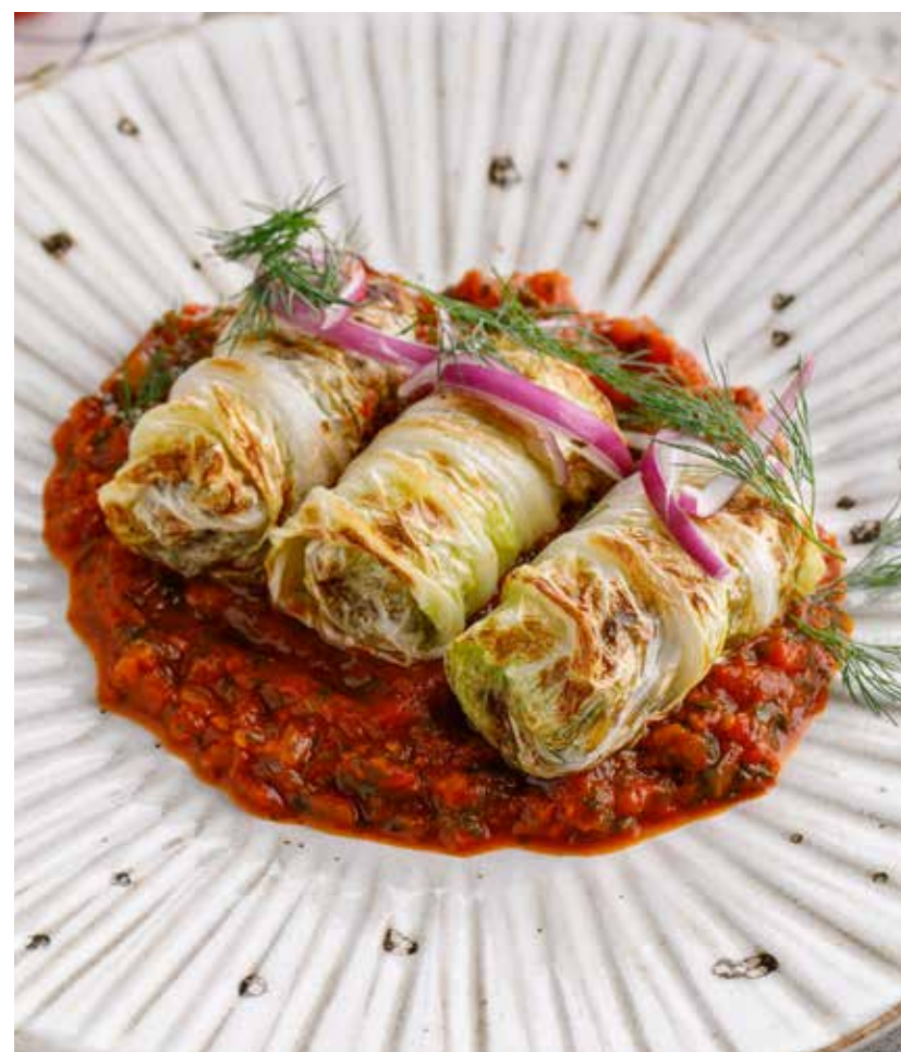
ГОЛУБЦЫ С БУЛГУРОМ