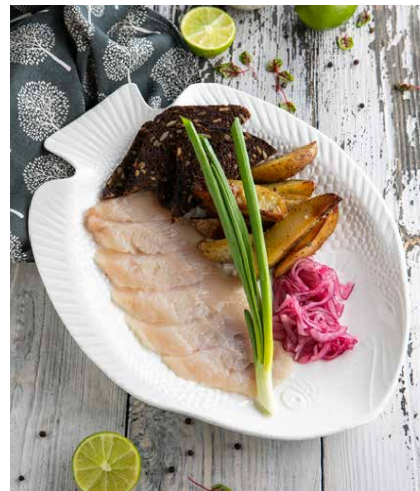
СИГ СЛАБОЙ СОЛИ