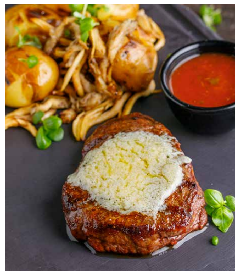
МЕДАЛЬОН ИЗ ГОВЯДИНЫ С СЫРОМ ГОРГОНЗОЛА / В МЕДОВО-ГОРЧИЧНОМ СОУСЕ