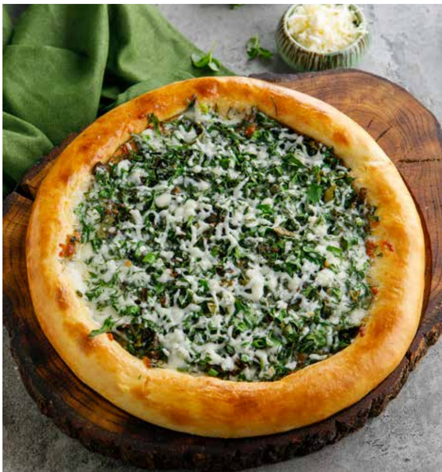
ХАЧАПУРИ СО ШПИНАТОМ