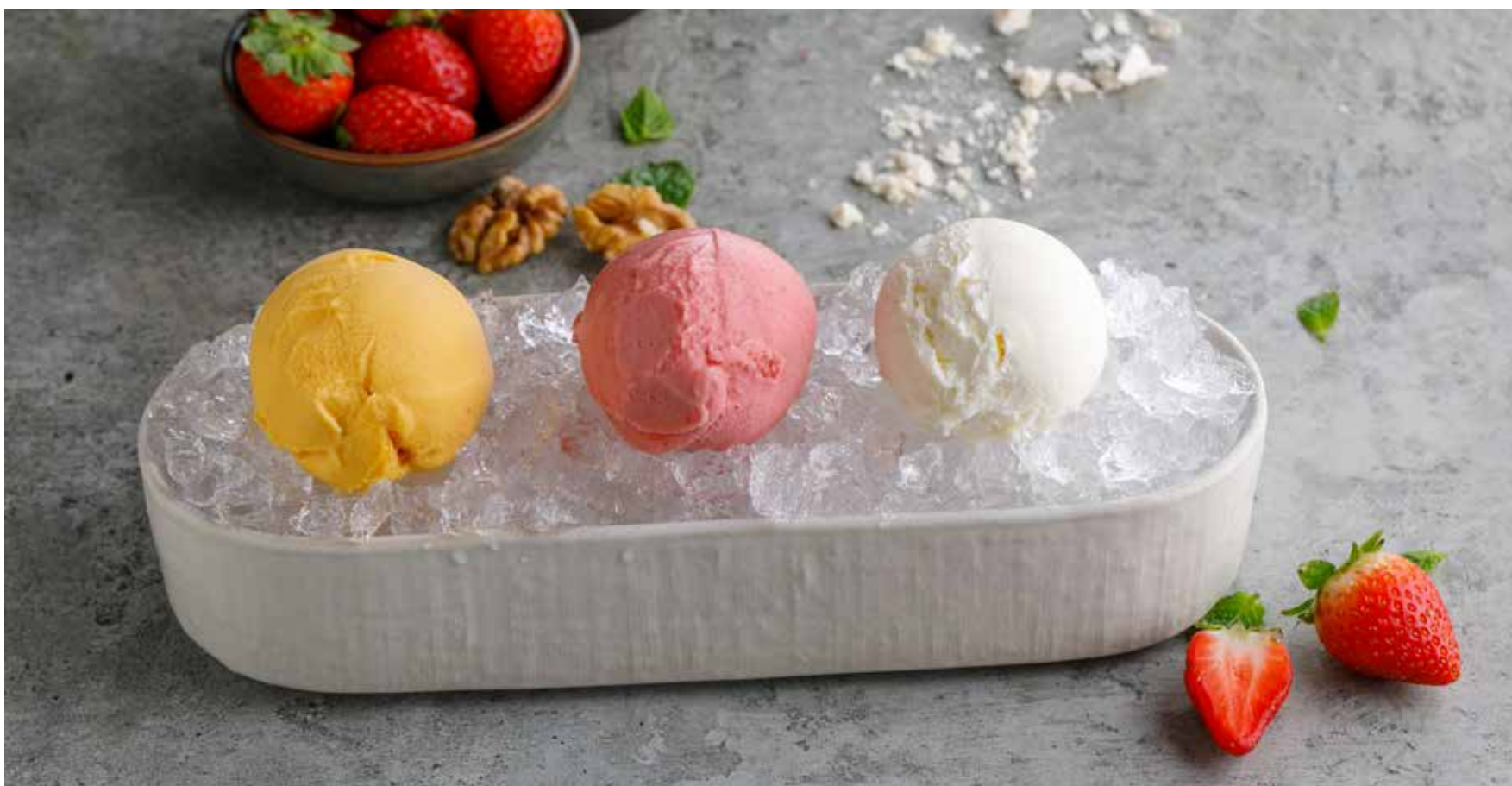
МОРОЖЕНОЕ в ассортименте