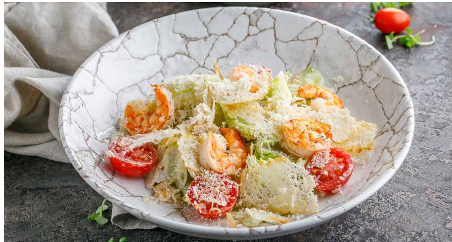
САЛАТ «ЦЕЗАРЬ» С КУРИЦЕЙ / КРЕВЕТКАМИ