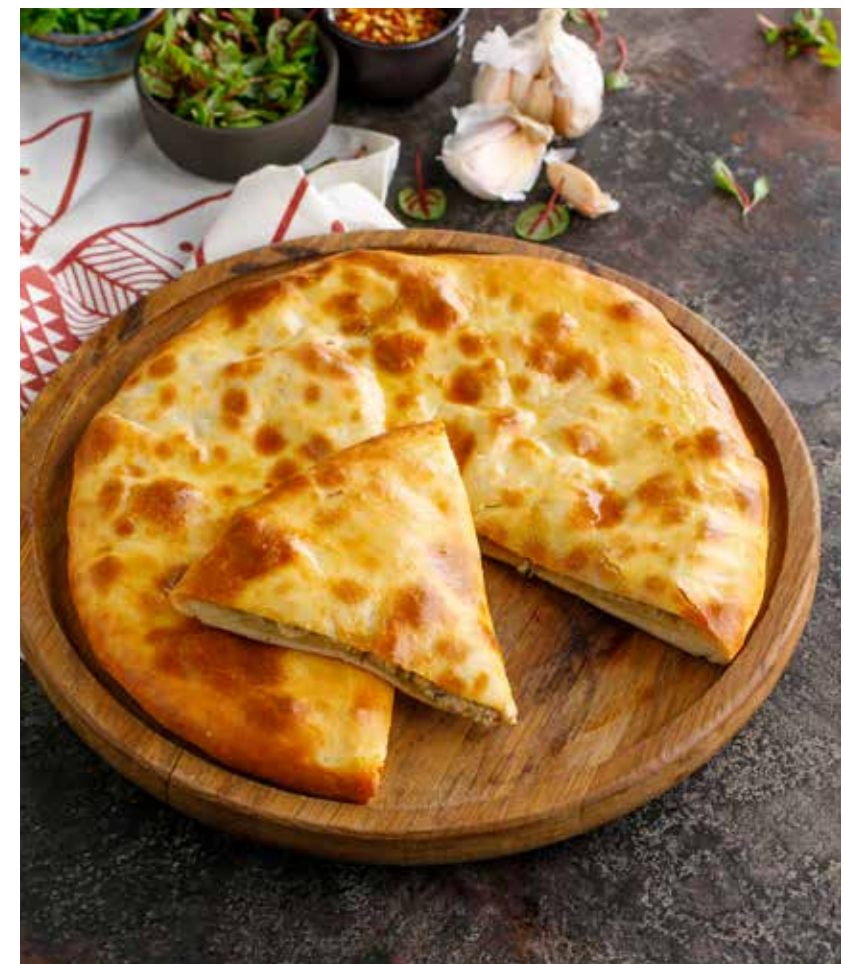
ХАЧАПУРИ С ТУНЦОМ