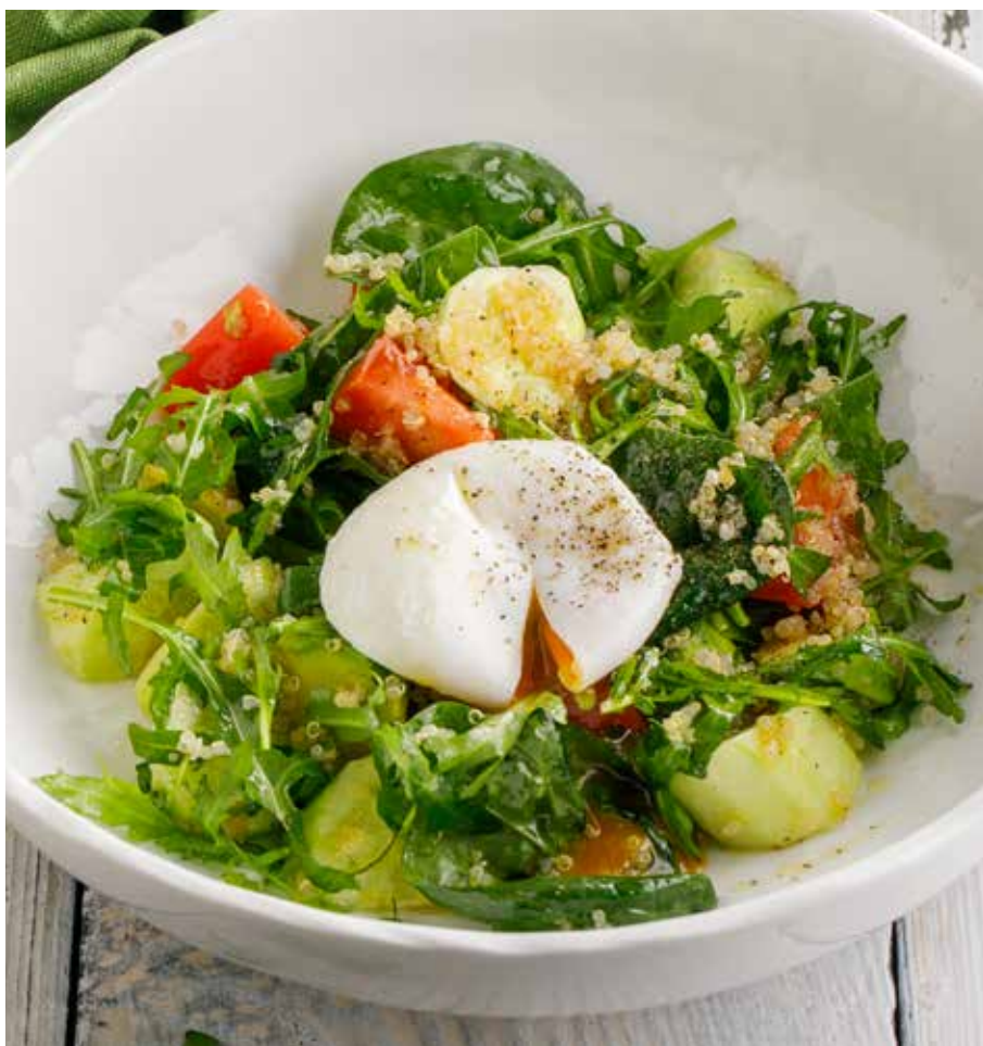
САЛАТ С КИНОА, АВОКАДО И ЯЙЦОМ ПАШОТ