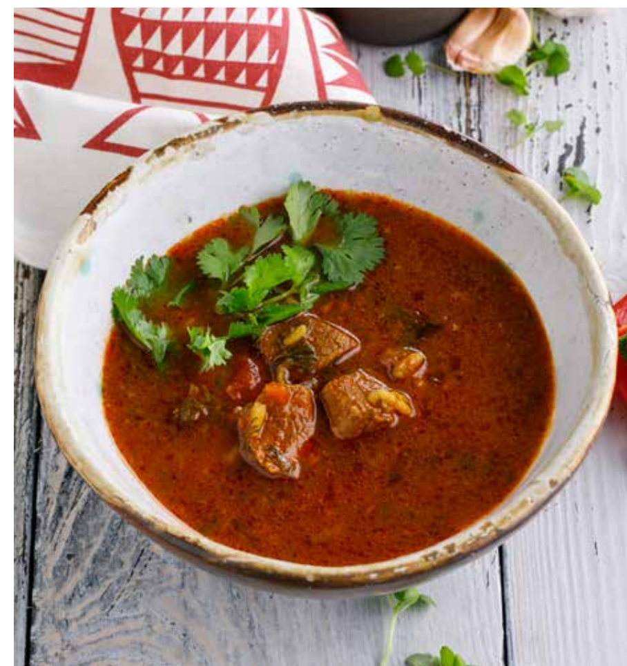
ХАРЧО С ТЕЛЯТИНОЙ