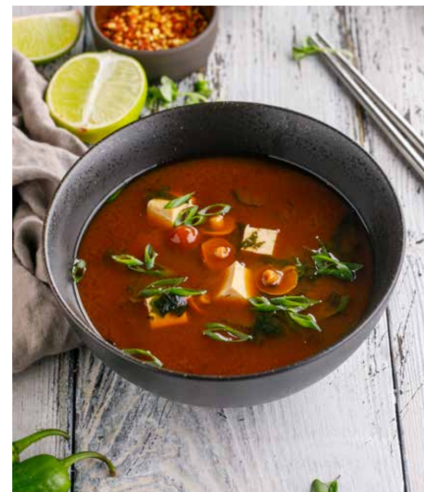
МИСО-СУП / МИСО-СУП С ЛОСОСЕМ