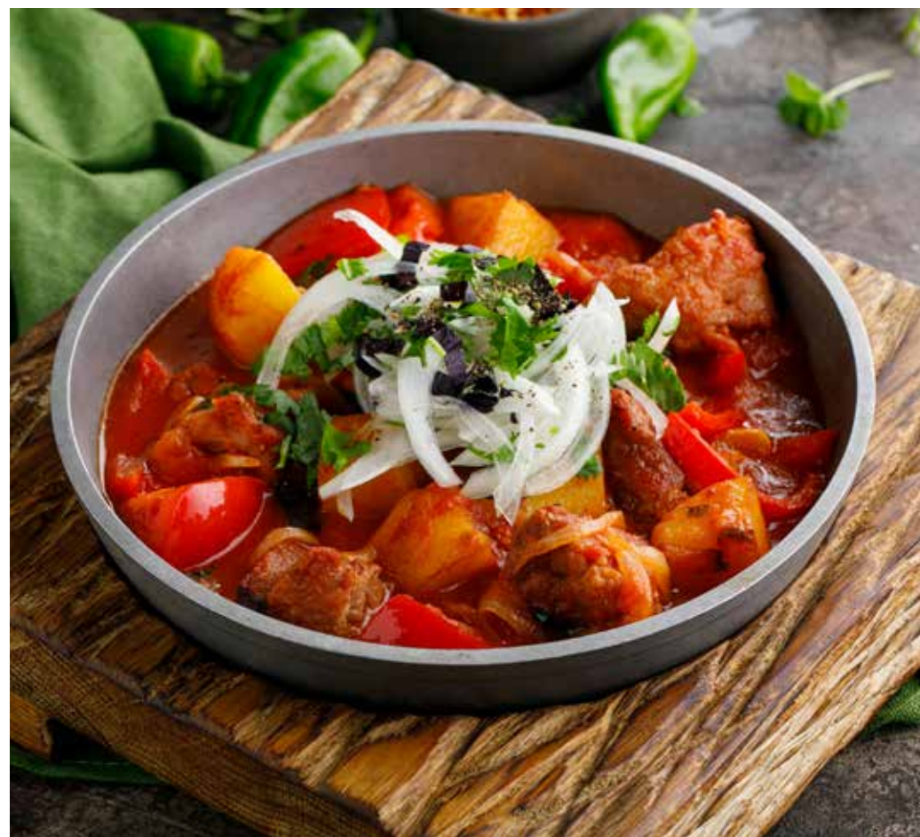
ОДЖАХУРИ ПО-МЕГРЕЛЬСКИ СО СВИНИНОЙ / КУРИЦЕЙ