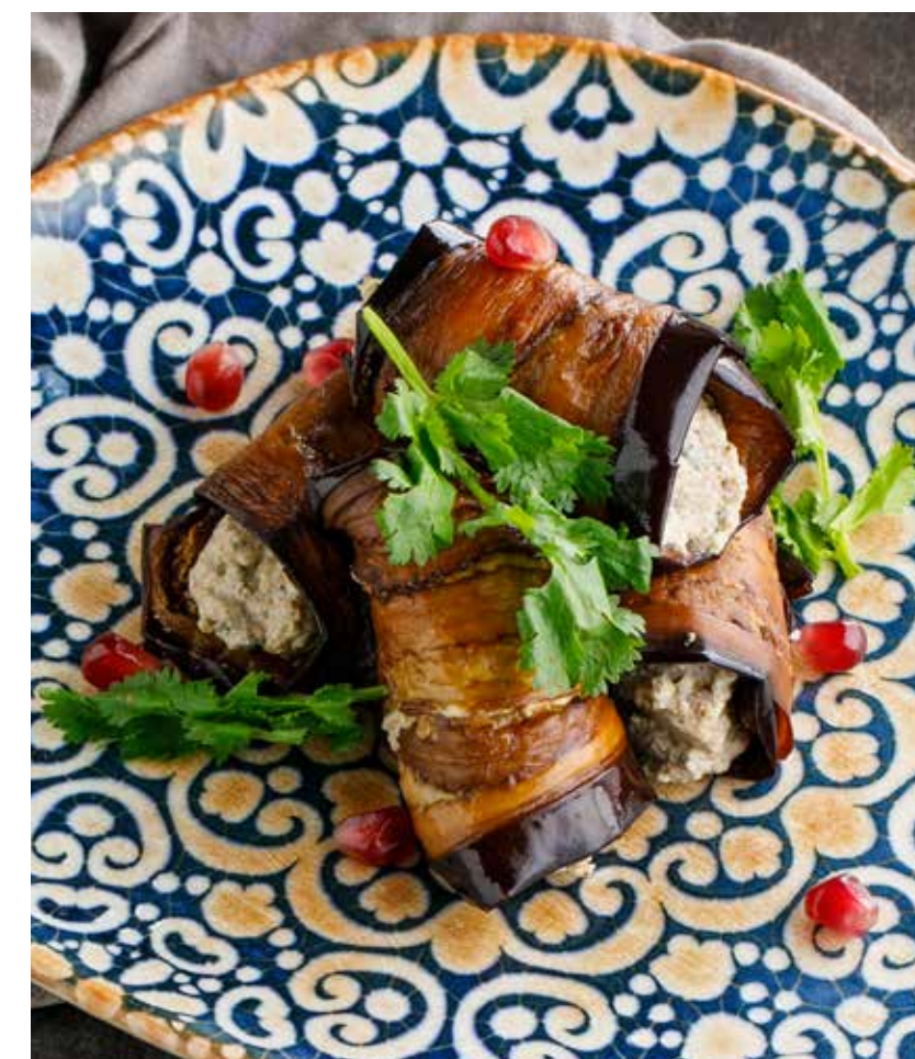
ЖАРЕННЫЕ БАКЛАЖАНЫ ПО-ГРУЗИНСКИ