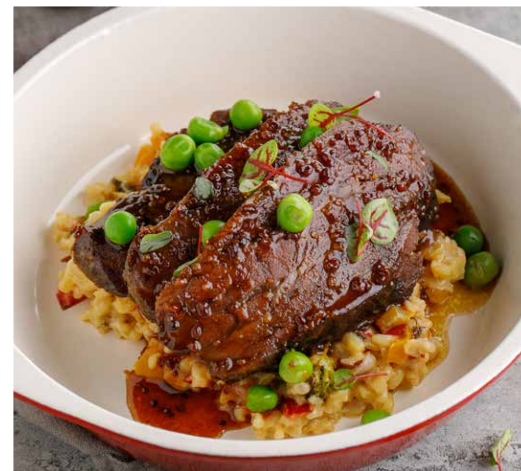
ТЕЛЯЧЬИ ЩЕЧКИ С БУЛГУРОМ