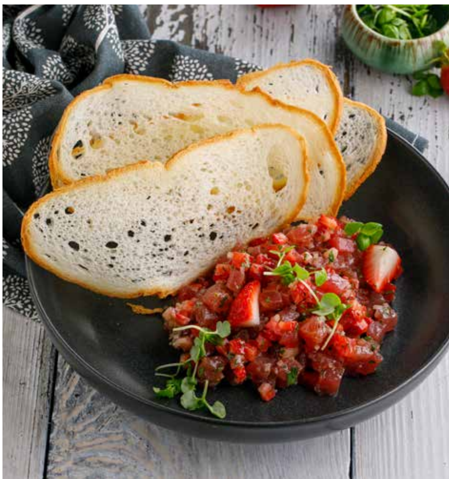
ТАРТАР ИЗ ТУНЦА