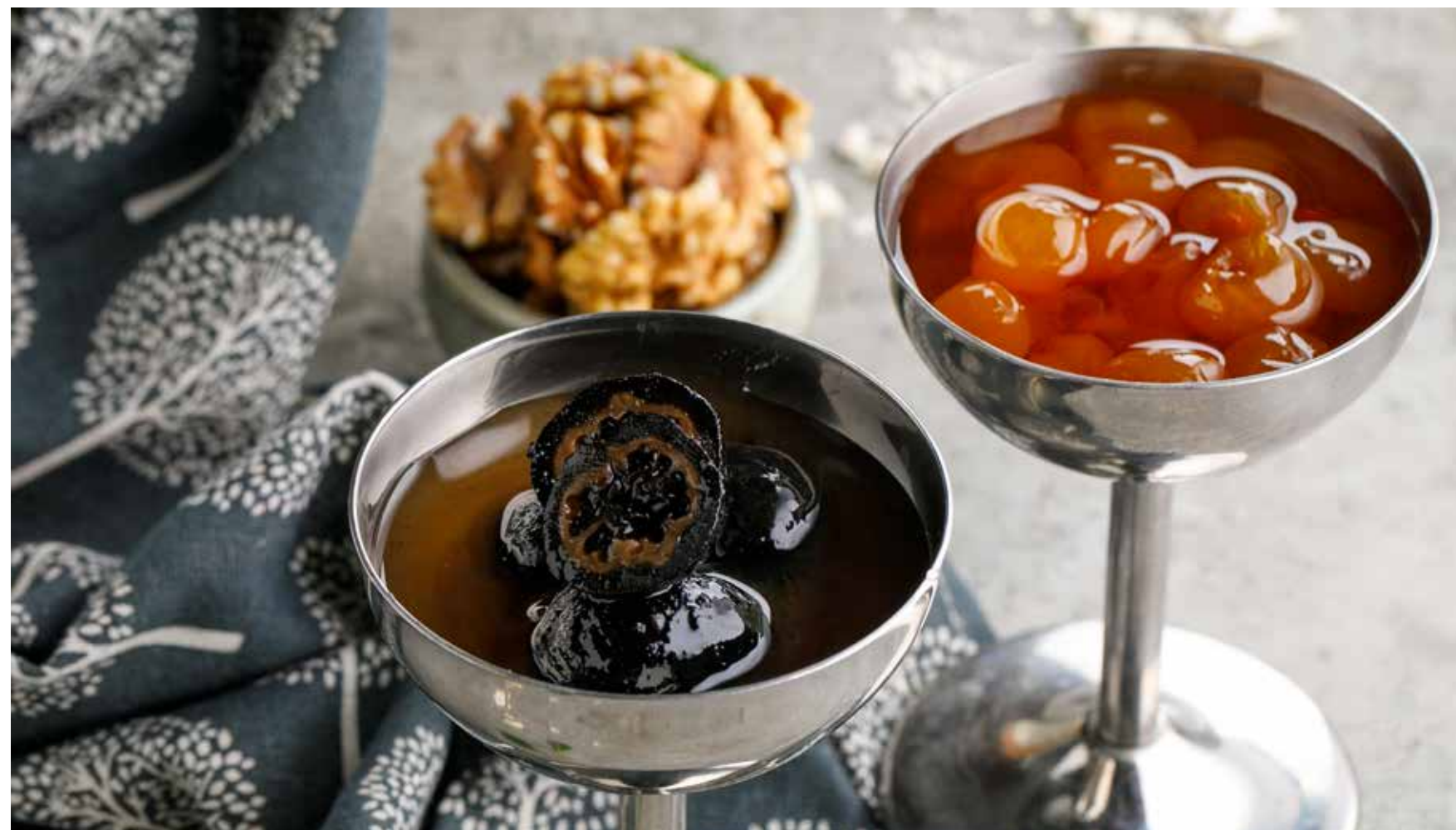
ДОМАШНЕЕ ВАРЕНЬЕ в ассортименте