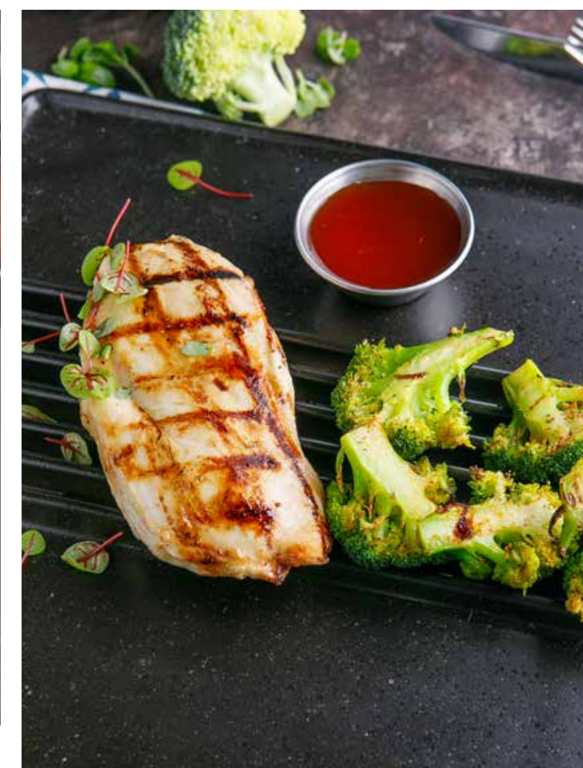
КУРИНАЯ ГРУДКА С БРОККОЛИ