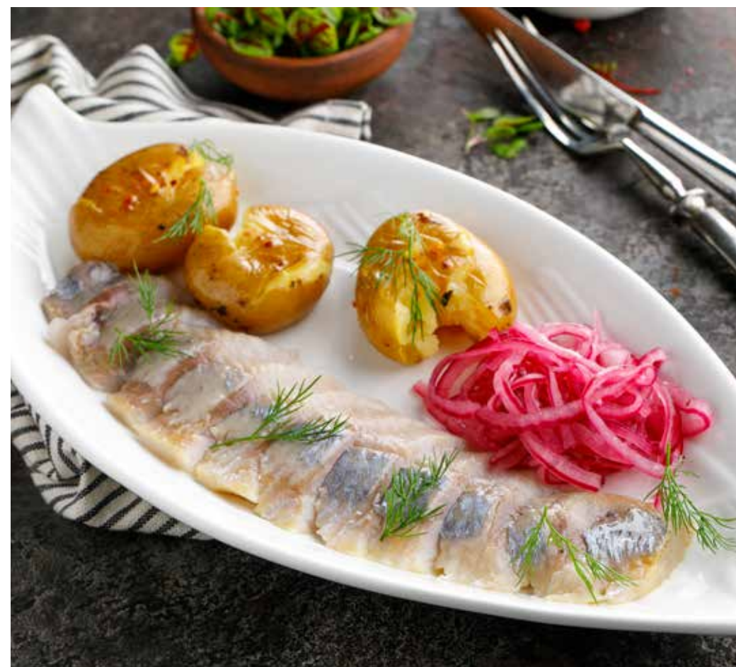
СЕЛЬДЬ С КАРТОФЕЛЕМ