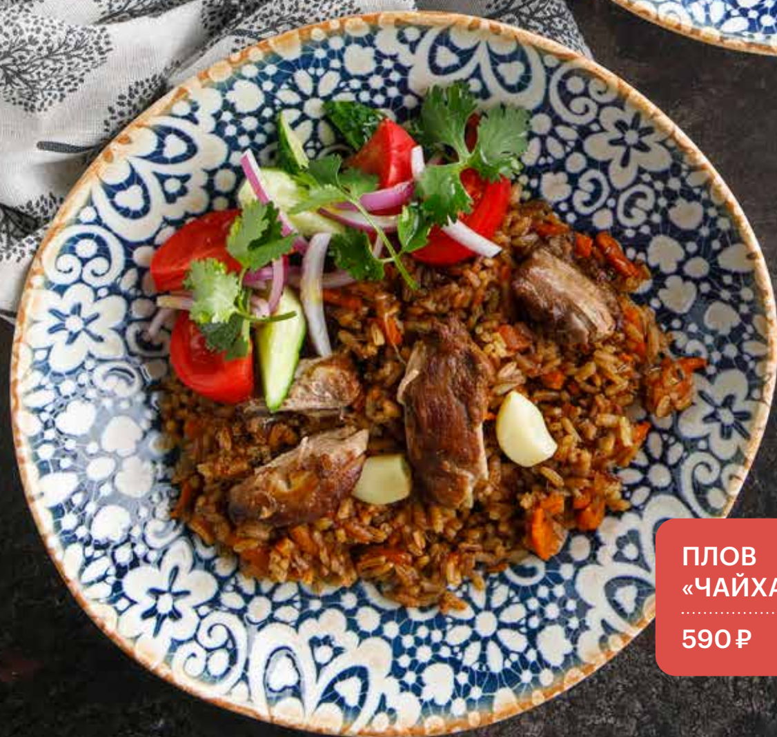
ПЛОВ «ЧАЙХАНСКИЙ» 590 ₽