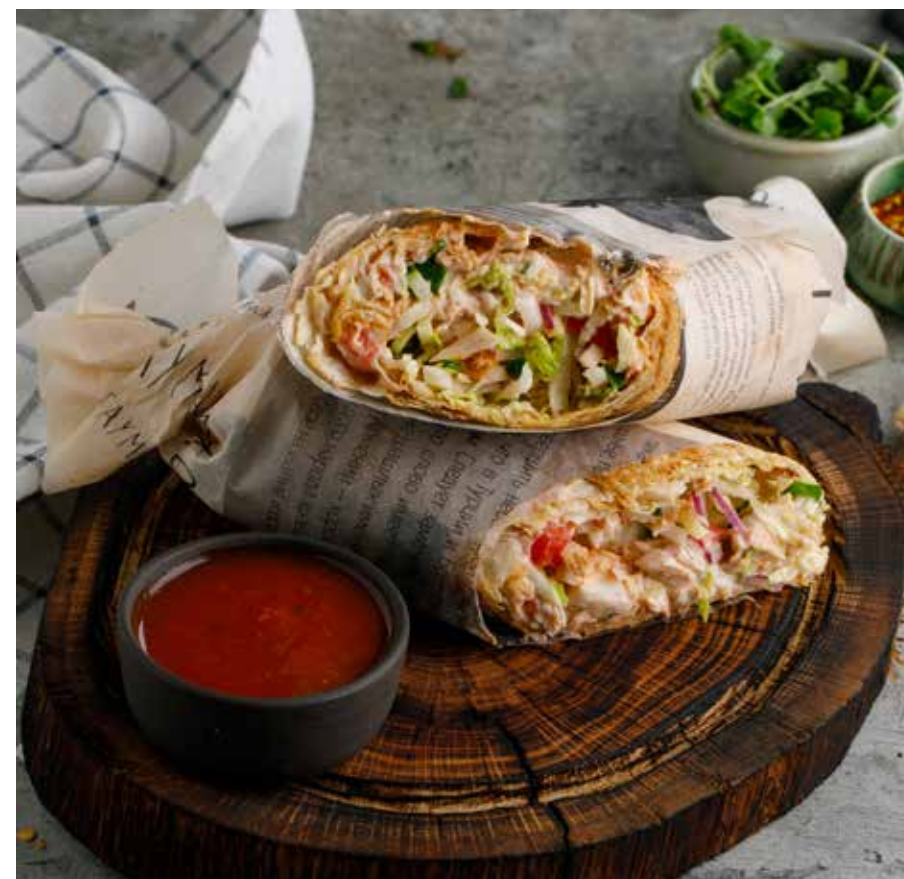
ШАВЕРМА С КУРИЦЕЙ И СОУСОМ САЦЕБЕЛИ / ЧЕСНОЧНЫМ СОУСОМ ШАВЕРМА С КРЕВЕТКАМИ