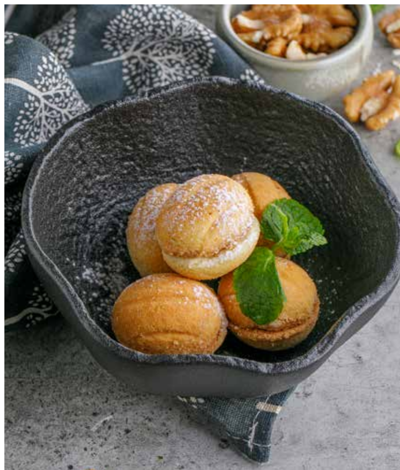
ОРЕШКИ С ВАРЕНОЙ СГУЩЕНКОЙ