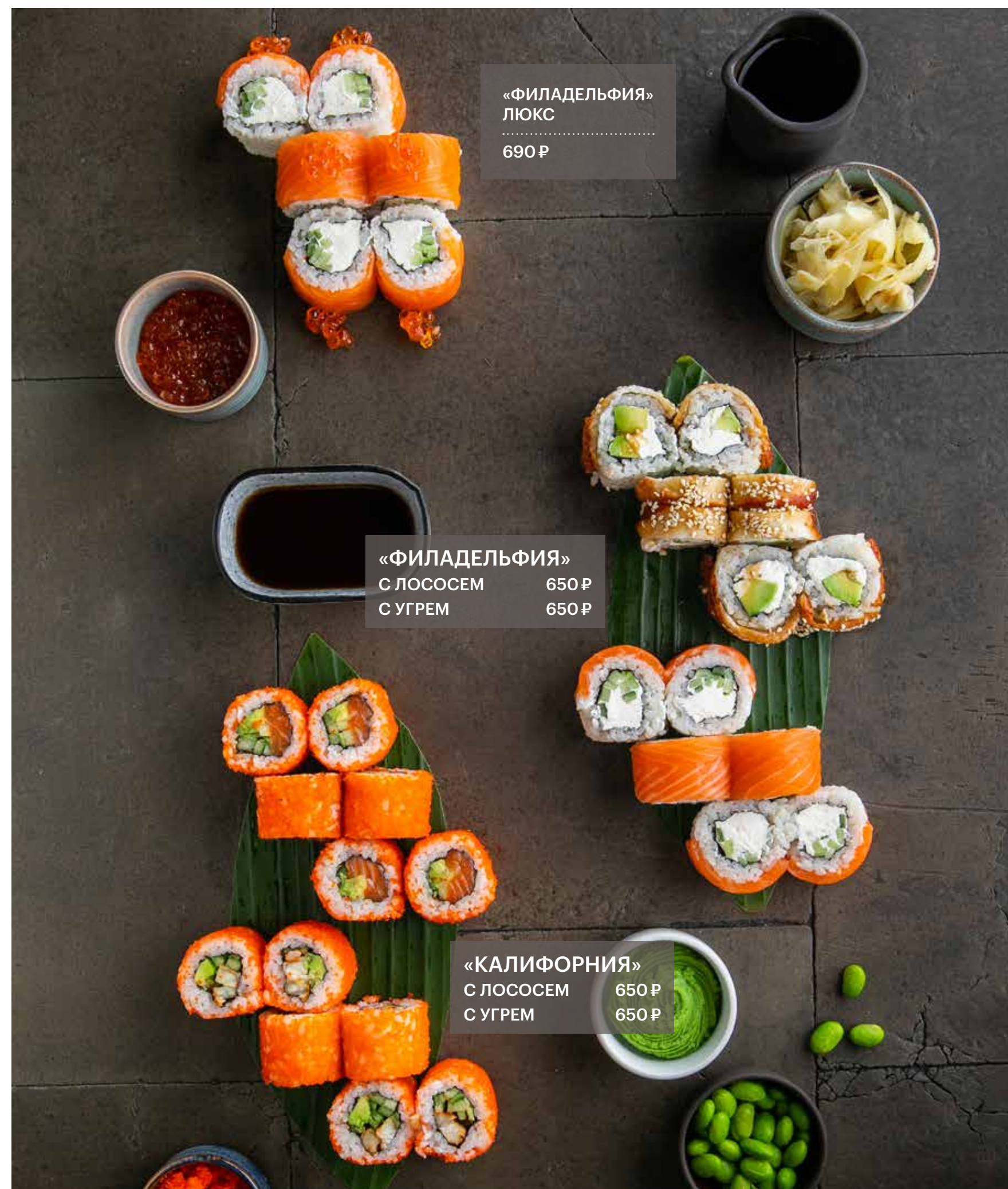
«ФИЛАДЕЛЬФИЯ» ЛЮКС 690 Р