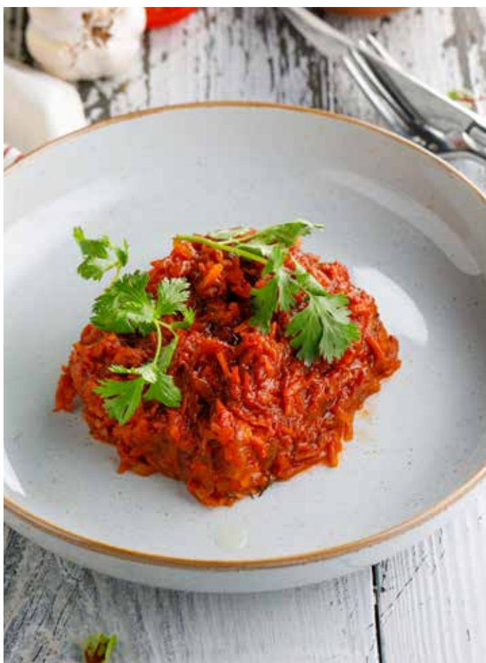
ТРЕСКА ПОД МАРИНАДОМ