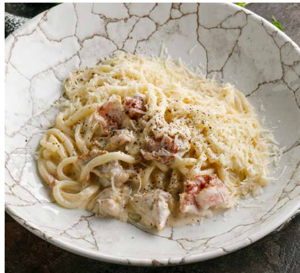
ДОМАШНЯЯ ПАСТА «КАРБОНАРА»