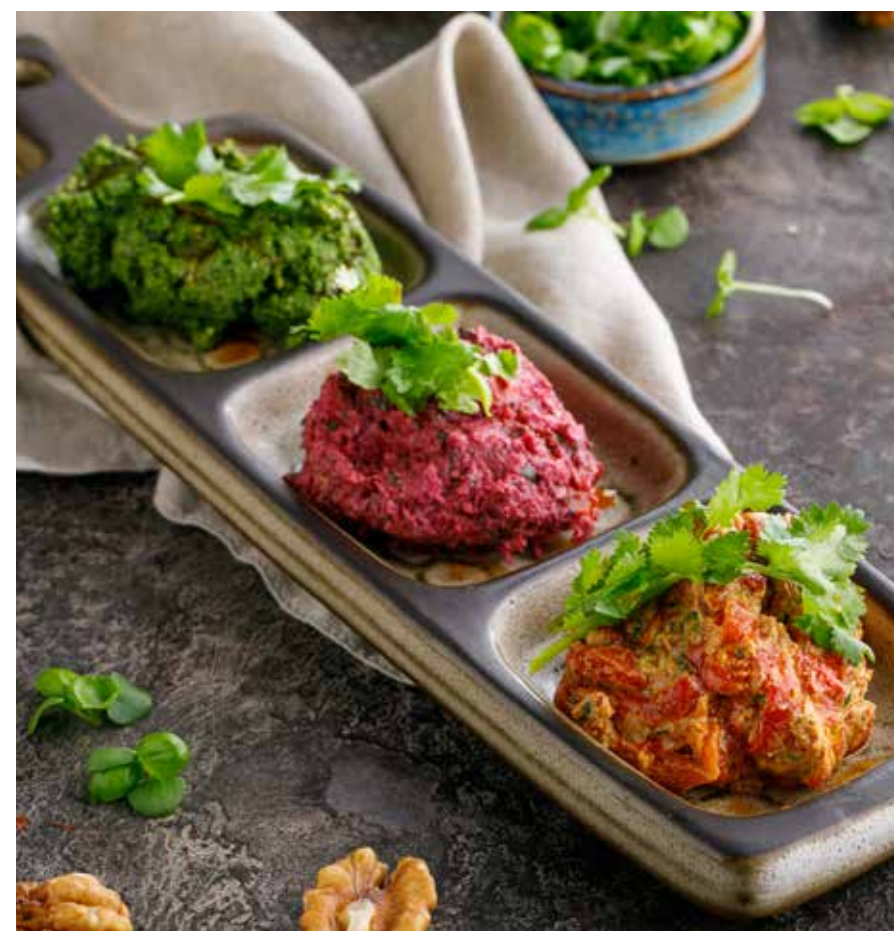
ПХАЛИ ШПИНАТ / ПХАЛИ ПАПРИКА / ПХАЛИ КАПУСТА И СВЕКЛА