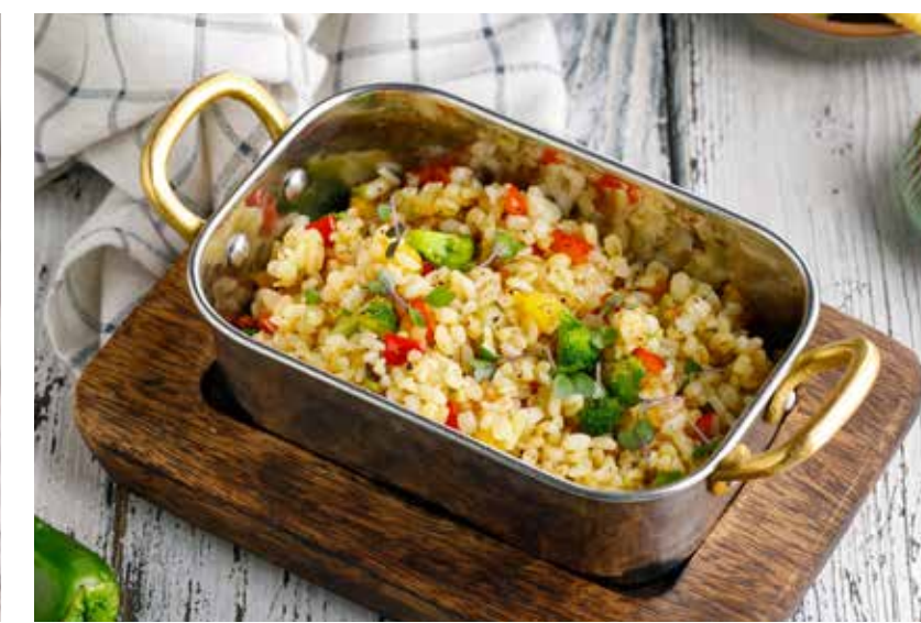
БУЛГУР С ОВОЩАМИ