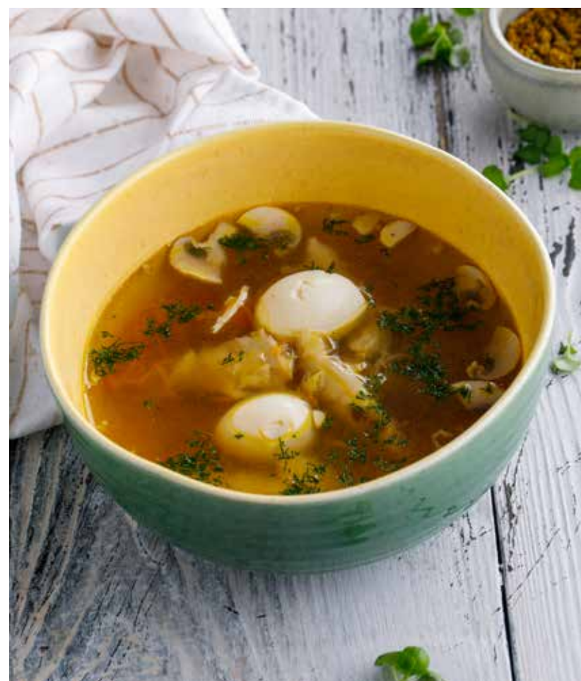
КУРИНЫЙ СУП С ДОМАШНЕЙ ЛАПШОЙ