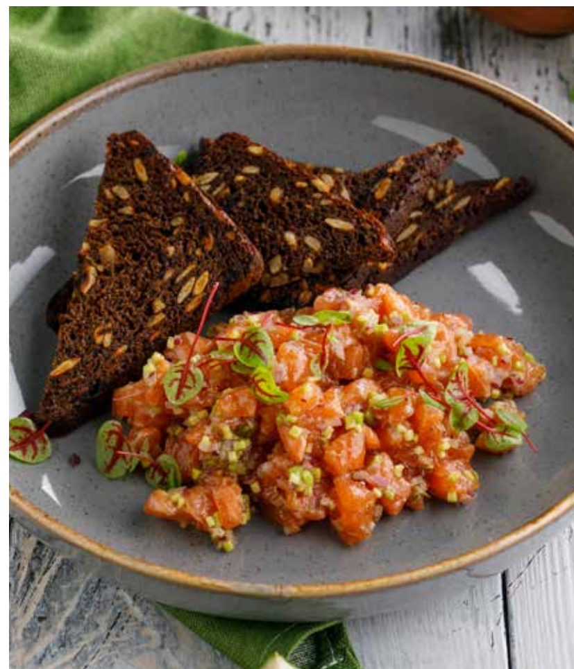
ТАРТАР ИЗ ЛОСОСЯ