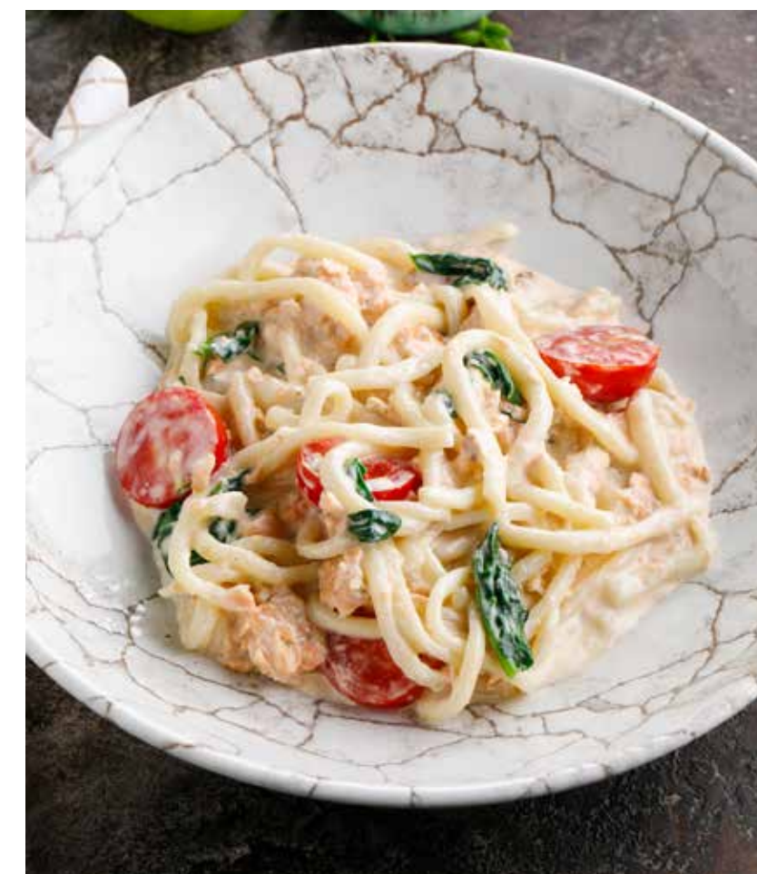
ДОМАШНЯЯ ПАСТА С КОПЧЕНЫМ ЛОСОСЕМ