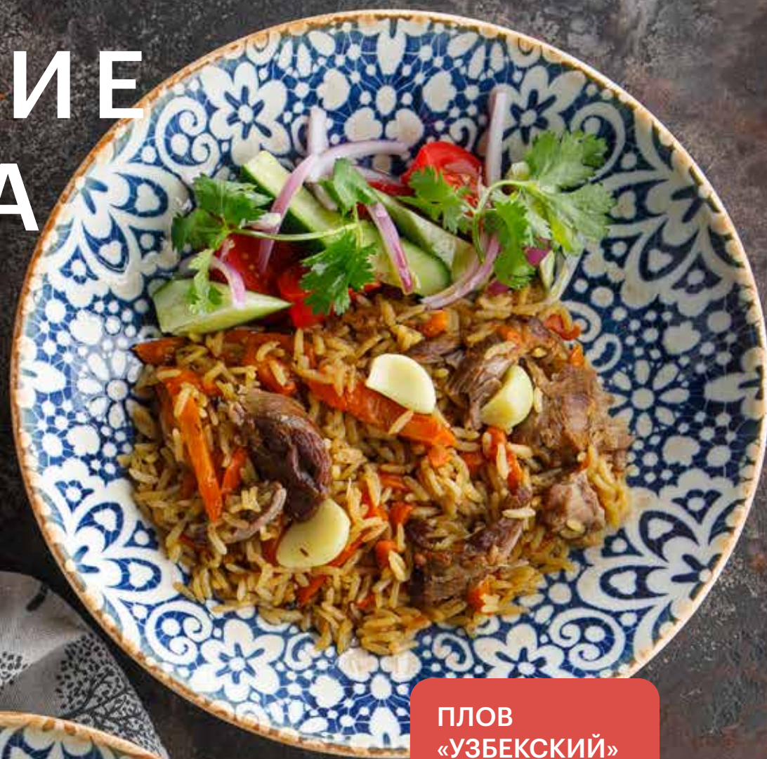
ПЛОВ «УЗБЕКСКИЙ» С БАРАНИНОЙ 590 ₽