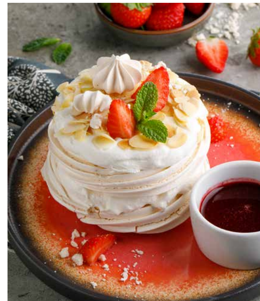
БЕЗЕ СО СЛИВОЧНЫМ КРЕМОМ