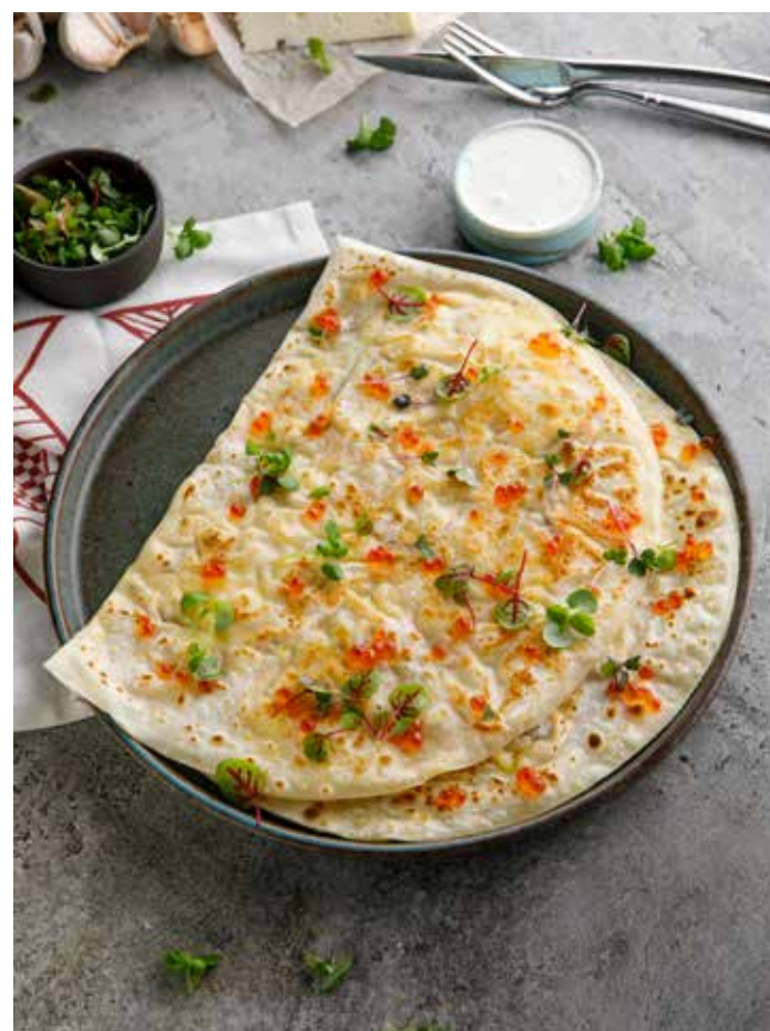
КУТАБЫ С КРЕВЕТКАМИ И КРАСНОЙ ИКРОЙ