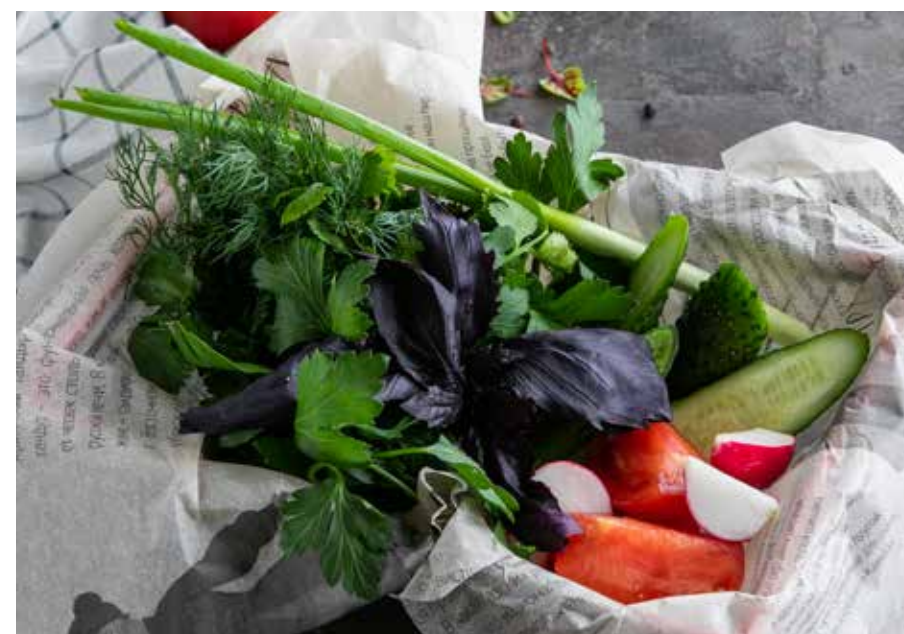
СЕЗОННЫЕ ОВОЩИ И ЗЕЛЕНЬ