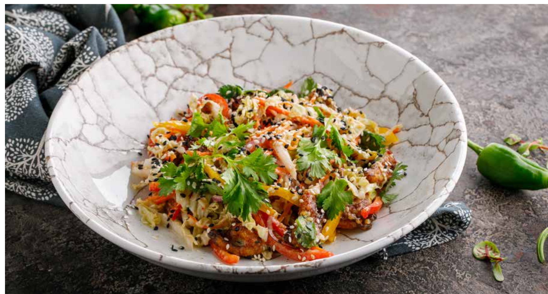
САЛАТ С КУРИЦЕЙ В АЗИАТСКОМ СТИЛЕ