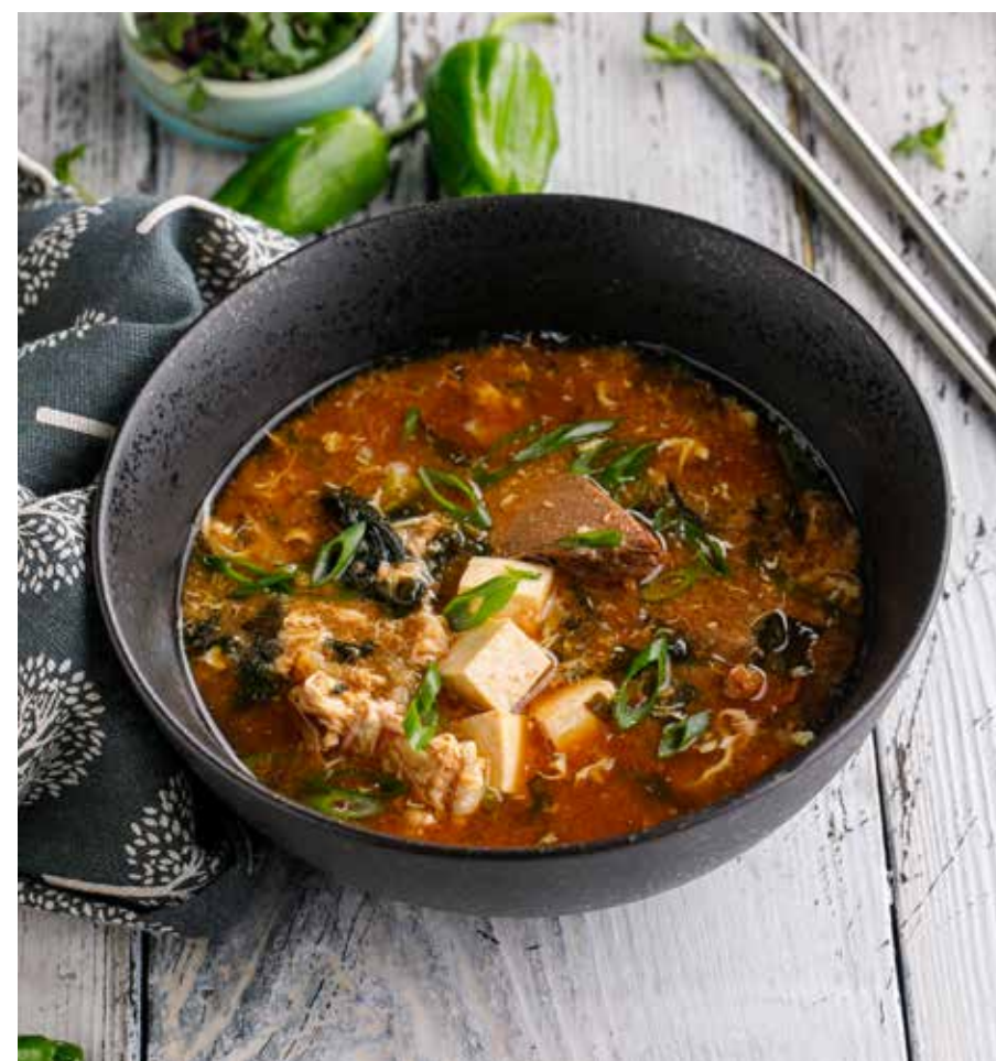
ОСТРЫЙ СУП КИМЧИ С ТЕЛЯТИНОЙ