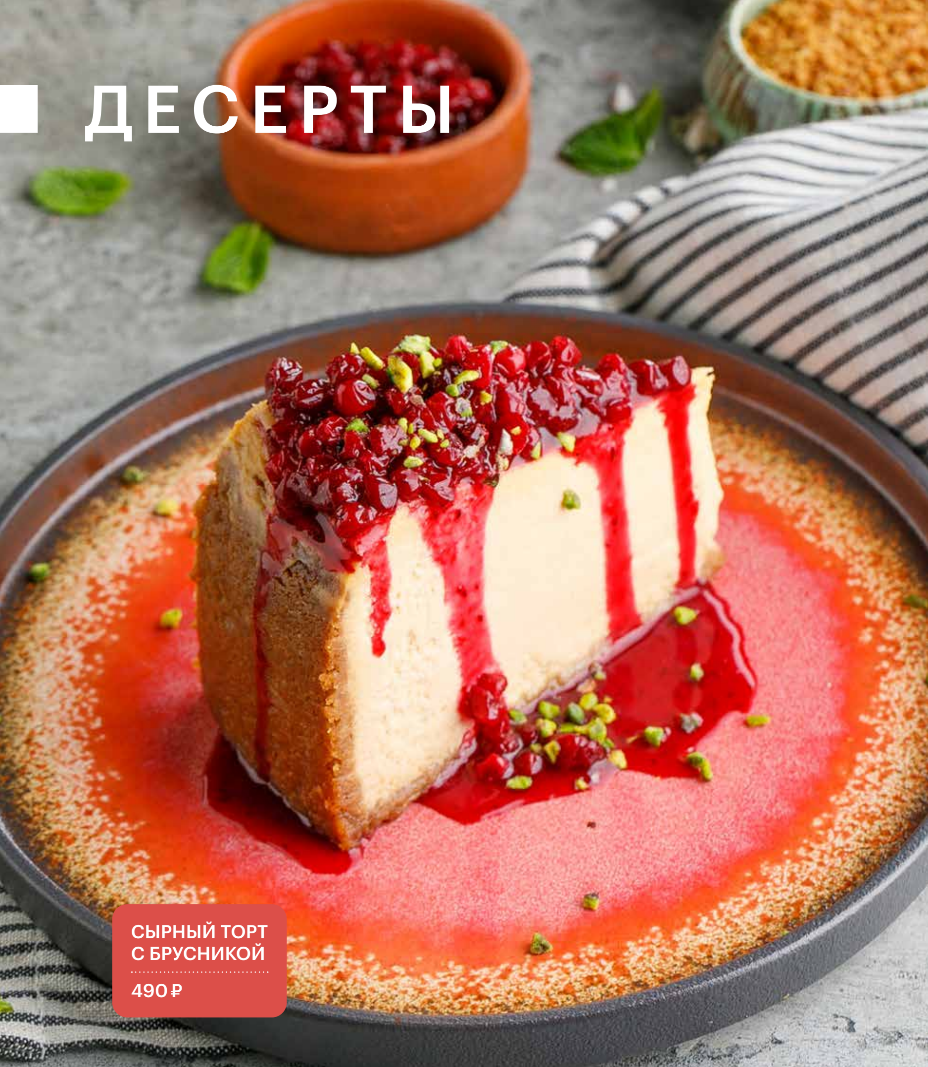
СЫРНЫЙ ТОРТ С БРУСНИКОЙ 490 Р