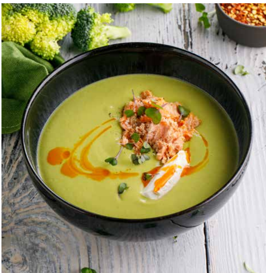
КРЕМ-СУП ИЗ БРОККОЛИ С КОПЧЕНЫМ ЛОСОСЕМ И СЛИВОЧНЫМ СЫРОМ